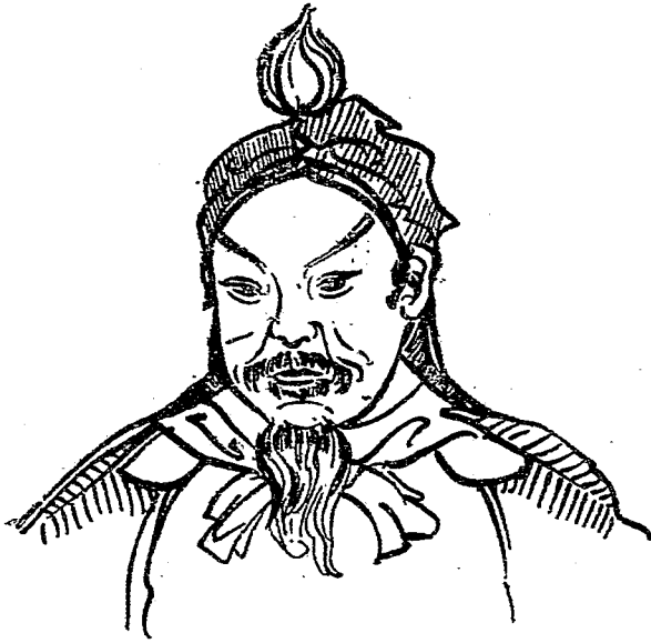
班 超 像

人類的公敵。反之，能夠起來抵抗這種外寇的侵略，發揚民族精神，增進民族光榮的人，才是我們的民族英雄！