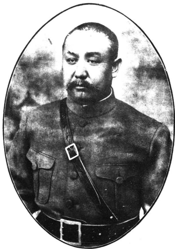
閣主 席 錫 山