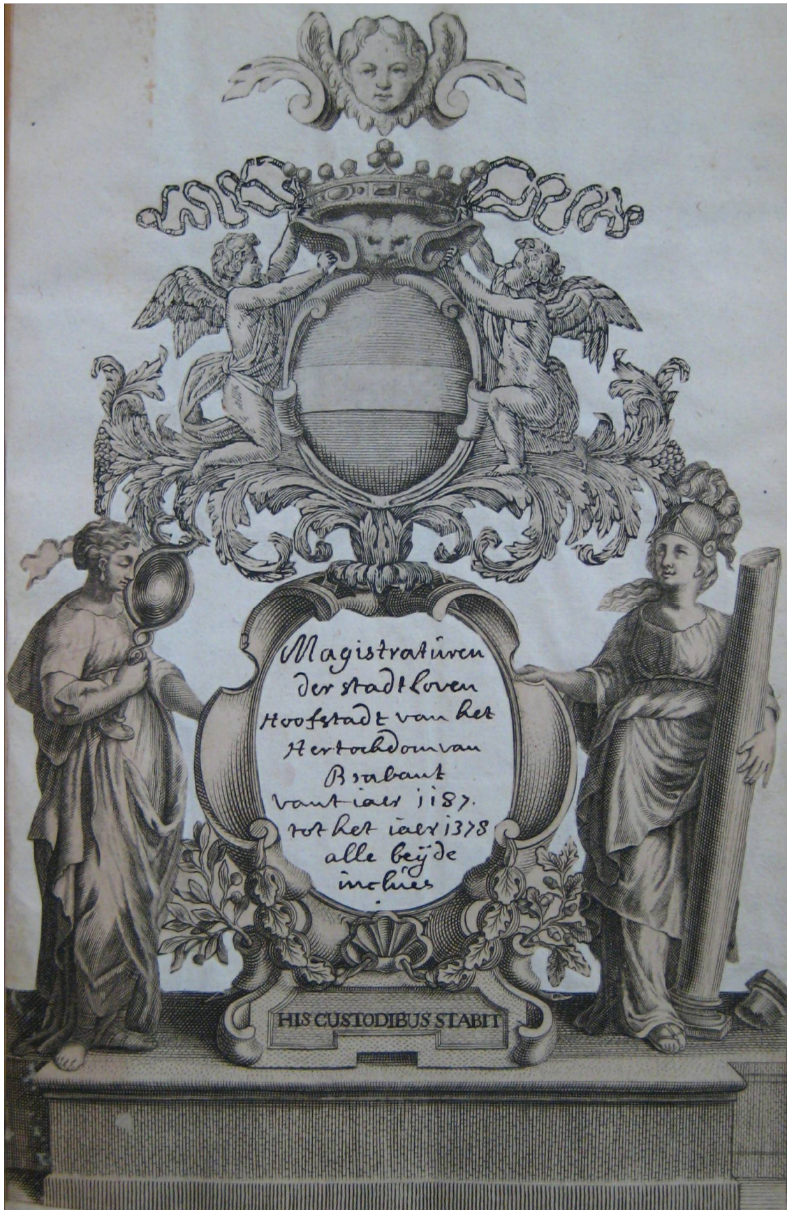
Figuur 2: Folio 1 van het Dienstboek met referentie SAL, 53