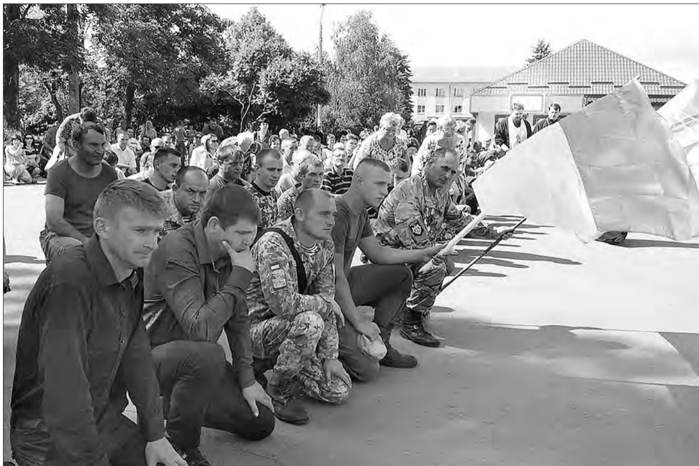
Народ, який схиляє голови і стає на коліна перед своїми загиблими героями-захисниками, ніколи не стане на коліна перед продажними і зрадливими політиками, а тим більше перед споконвічним ворогом — Росією