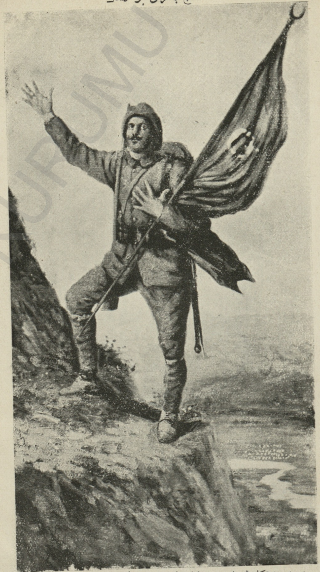
یوچه صنعتکار شهزاده من دولتلو، مجاہدلو عبدالمجید افندی حضرتلری طرفندن بالخاسه شعر ایچون یاپیلاراق ارمنان ایلمشدر.