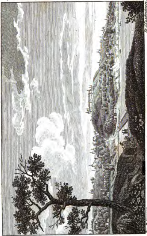
Видъ Владивѣрка на Красноярскъ, съ Нижегородской Дорогой.