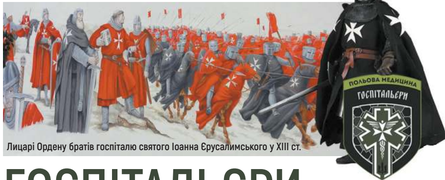
Лицарі Ордену братів госпіталю святого Іоанна Єрусалимського у XIII ст.