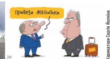
Карикатури Сергія Йопкіна