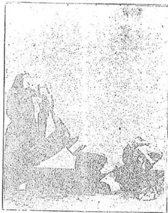
◁門山打醉之山桂何▷