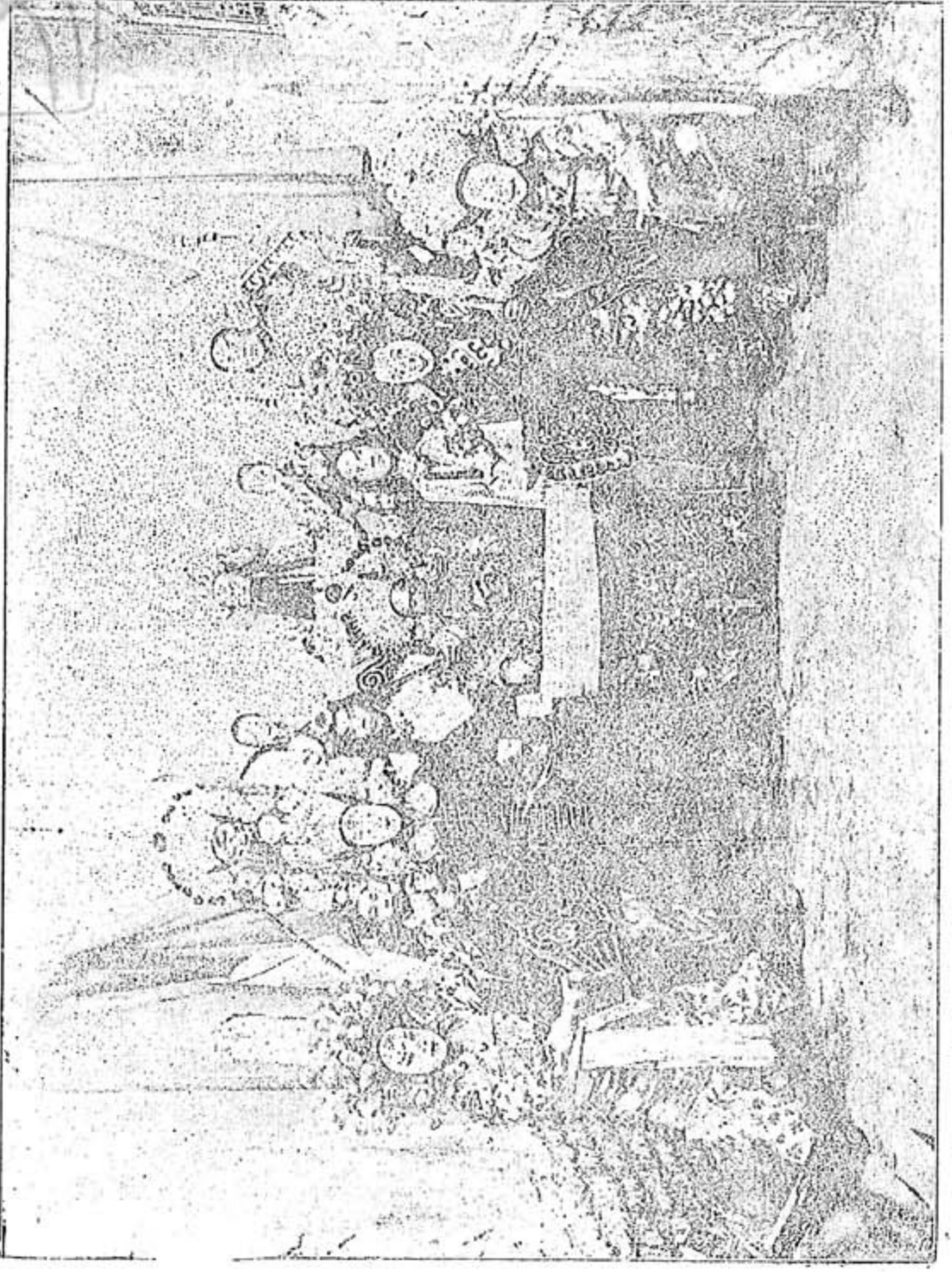
△榮慶社全體合演青石山△