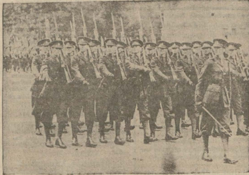
Sarre'a gönderilen İngiliz kuvvetlerinden bir kol ..

ATINA, 10 (A. A.) — Gazetelerin öğrendiklerine göre Tevfik Rüştü Aras Cenevreden Ankaraya dönerken Atinaya uğrayacaktır. Türkiye Dışişleri Bakanının bu ziyaretinin başlıca ilksüsü uluslar derneğinin işleri ve hali hazırda Cenevrede toplanmakta olan Balkan anlaşması dış işleri bakanlarının konuşmaları hakkında Yunan hükümetine bilgi vermektir.