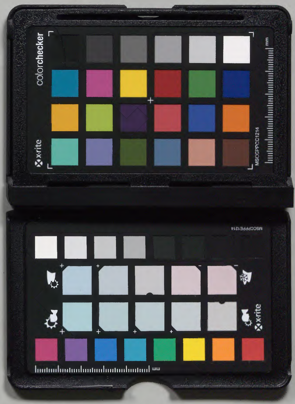
裏面記載のない箇所は省略