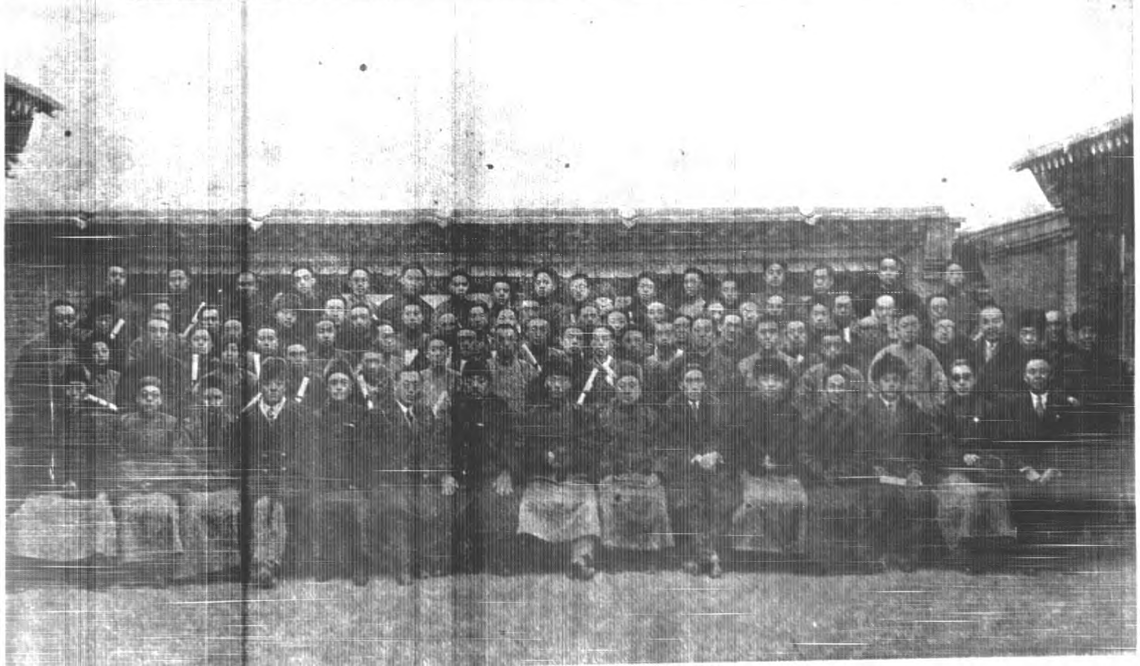
察哈爾教育廳第一屆注音符号班講習班畢業攝影 民國廿二年二月