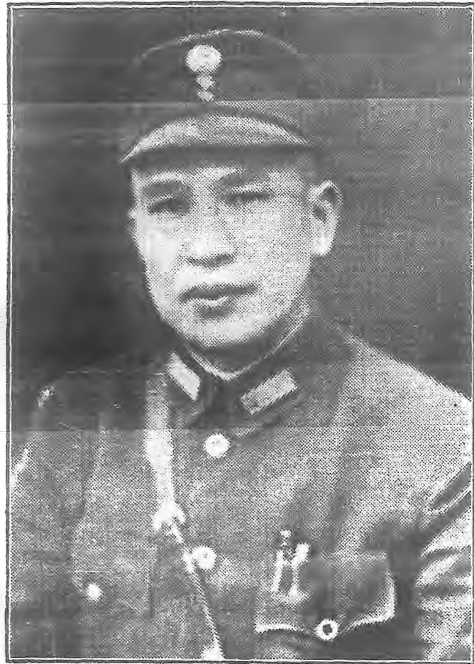
白副會長崇禧肖像