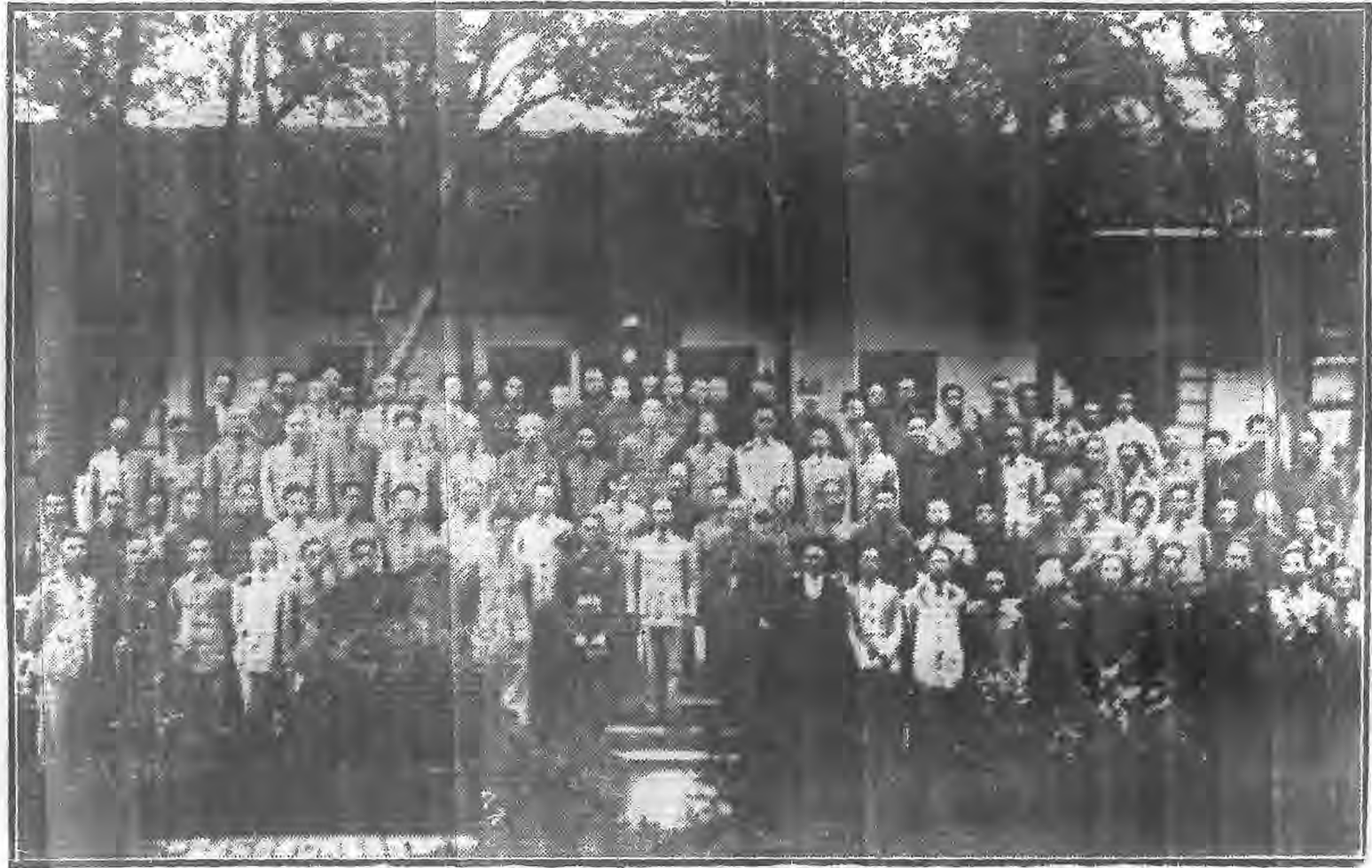
本會兩週年紀念全體攝影 二十八年八月十九日