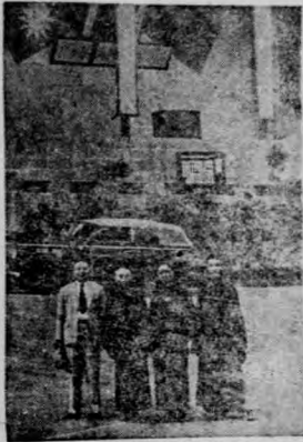
1 2 3 4

第二次世界大戰，是正義與強權的戰爭，中國是反侵略反法西斯的先鋒，我國的盟友羅斯福先生，不幸為消滅共同敵人，實現四大自由奮鬥而逝世，耗盡傳來，海海同悲，陪都醫界首領致復興關公祭後留影。(1)趙主任(2)張理事長(3)鄧理事長(4)章秘書長。