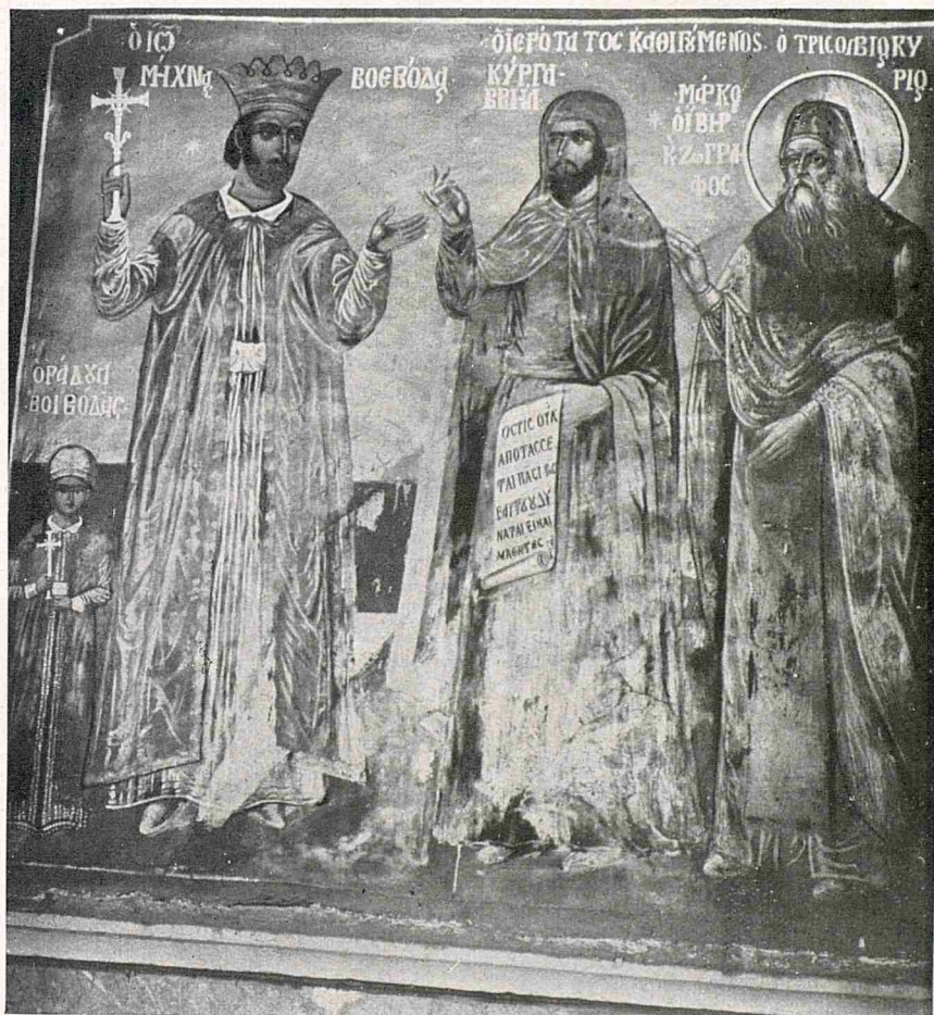
Chipurile de la Athos ale lui Mihnea-Vodă și fiului său Radu