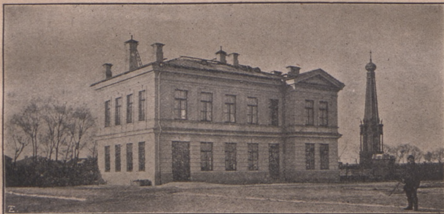
Budynek dla anatomii normalnej. (Po stronie prawej widać pomnik bitwy grochowskiej, na której polach leży Instytut).

Budynek dla epizoocyologii, bakteryologii i anatomii patologicznej. Zdała poza gmachem głównym, ze strony prawej tegoż i od targu końskiego znajduje się budynek w większej części jednopiętrowy, w mniejszej parterowy, — pierwsza część przeznaczona jest dla zwierząt podległych choro-