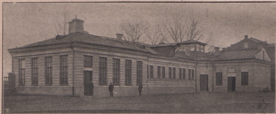
Klinika chirurgiczna od strony podwórza.

Sala operacyjna zajmuje całą szerokość budynku, oświetlona dziesięcioma dużymi oknami od ulicy Grochowskiej i Terespolskiej, oprócz tego zaopatrzona jest jeszcze oświetleniem górnym; podłoga tutaj ułożona jest z kostek drewnianych na pokładzie cementowym. Z sali operacyjnej jedno wejście prowadzi do stajni, drugie na kurytarz. Stajnia po środku ma szeroki pasaż, po bokach którego