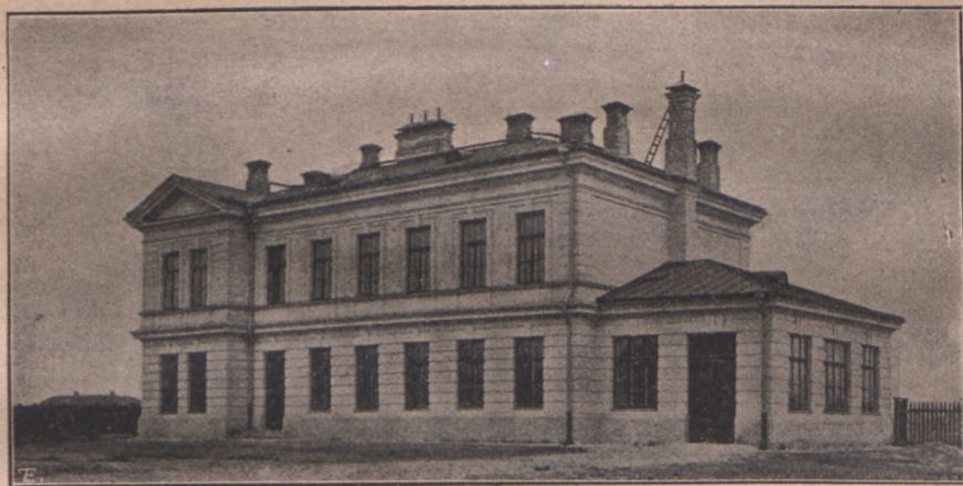
Budynek dla epizoocyologii, bakterjologii i anatomii patologicznej.

Budynek kuźni, w części jednopiętrowy, w części parterowy, znajduje się pośrodku między budynkiem anatomii normal-