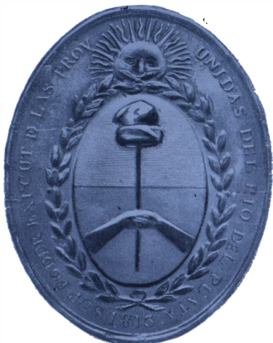
Sello del Gobierno

Grabado por Juan de Dios Rivera (poruano nacido en el Cuzco) (Museo Histórico Nacional)