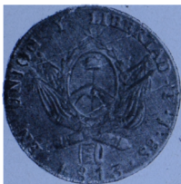
Anverso de la onza de oro, sancionada por la Asamblea, sesión 13 de abril de 1813, acuñada en Petrai en el mismo año. (Ley núm. 464, Registro Oficial.)