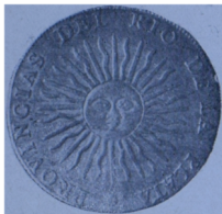
Reverso de la ouza de oro y el peso fuerte. (Museo Histórico Nacional)