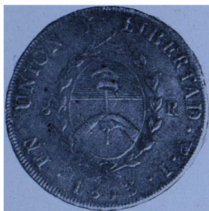
Anverso del peso fuerte.