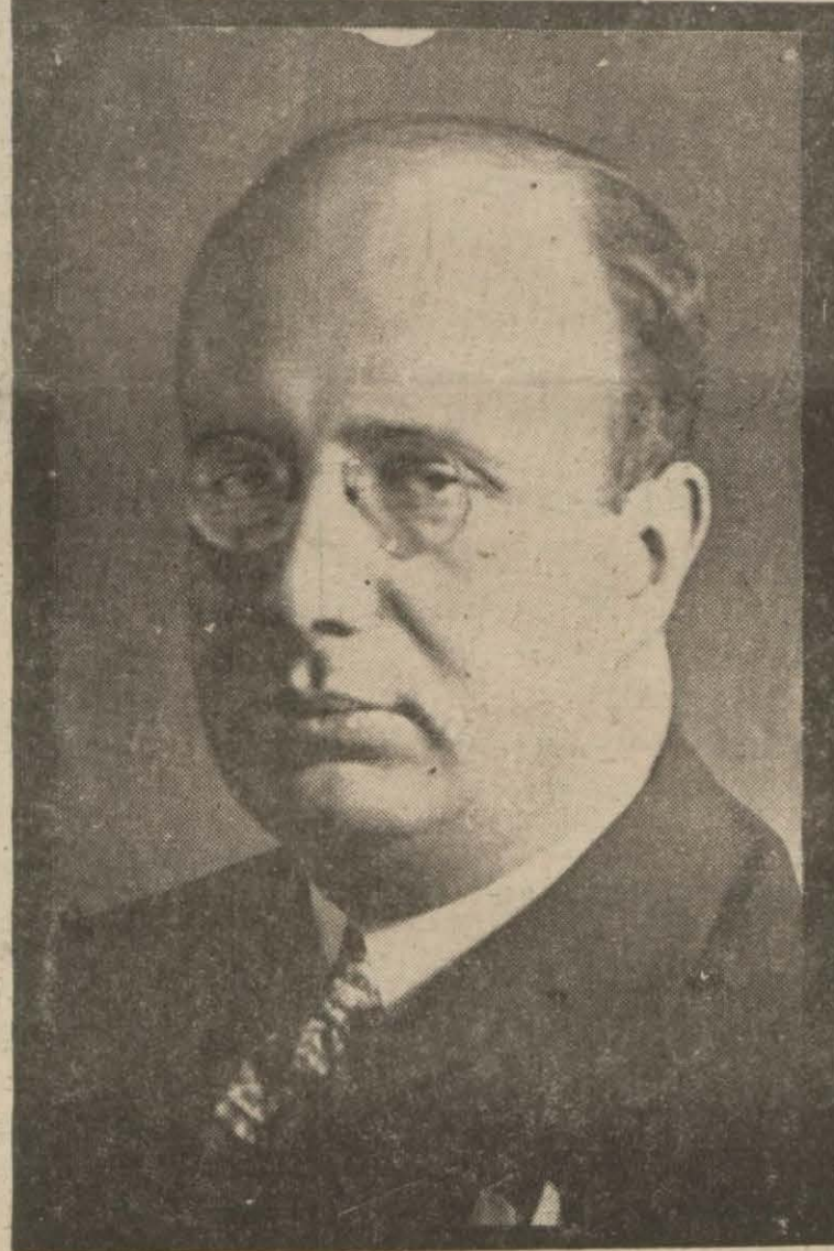
Moskova Büyük Elçimiz Vasif Çınar

Geçen yılın yağışlı bir gününde de andık. Reşid Galib'i, bu vakitsiz sönen bir başka devrim çocuğunu Cebeciye götürdüğümüz o (Sonu 2 inci sayıfada)