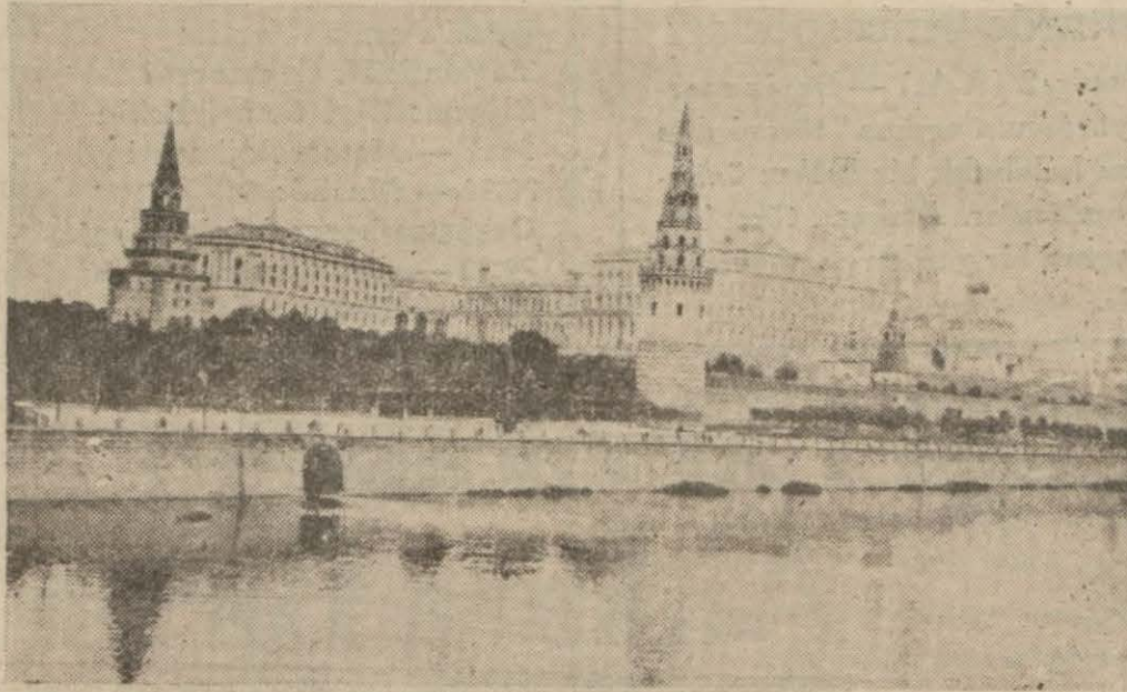
Vasif Çınar'ın son dakikalarını yaşadığı Kremlin ve önünde Moskova nehri.