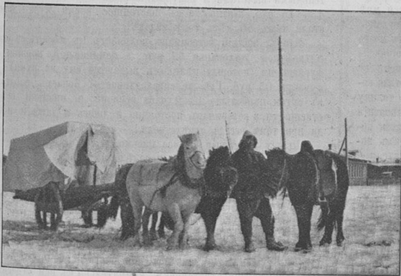
Перевозка раненыхъ (къ статьѣ «Зимняя экспедиція полковника Ирмана въ Монголію»).

Въ другой разъ, возвращаясь изъ Польши, я удостоился знакомства съ уволеннымъ въ запасъ полковымъ писаремъ, который взялъ меня подъ свое покровительство, очень мило и снисходительно со мною бесѣдовалъ и даже убѣдилъ меня забраться на ночь на полку надъ головами пассажировъ, гдѣ