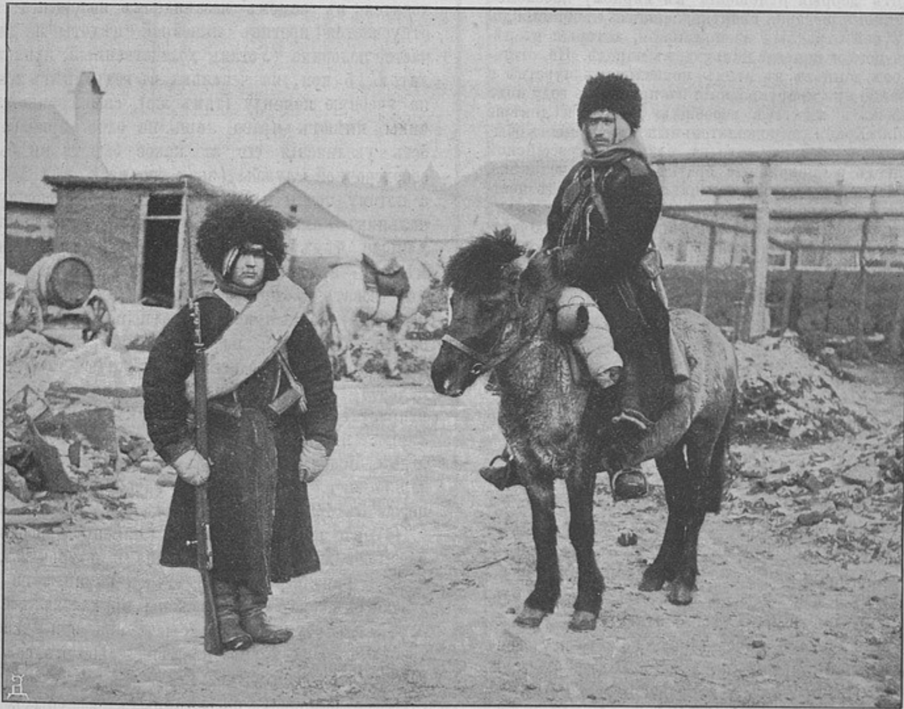
Спѣшившіяся и конный стрѣлки конно-охотничьей команды 17-го Восточно-Сибирскаго стрѣлковаго полка въ походномъ снаряженіи. (къ статьѣ «Зимняя экспедиція полковника Ирмана въ Монголію» **).

сдержанно и терпѣливо переносили обидныя и явно враждебныя выходки противъ нихъ толпы и отдѣльныхъ личностей. Получивъ однакоже затѣмъ приказаніе очистить площадь и примыкающія къ ней улицы, оренбургцы, двигаясь шагомъ и предупреждая толпу о расхожденіи, были встрѣчены градомъ сыпавшихся на нихъ камней, ледяшекъ, полѣньевъ, палокъ и даже бутылокъ *), чѣмъ были поставлены въ неизбежную необходимость прокладывать себѣ путь силою и прибѣгнуть къ нагайкамъ.