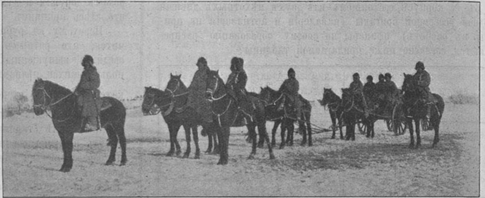
Монгольская экспедиція. Ноябрь и декабрь 1901 г. (къ статьѣ «Зимняя экспедиція полковника Ирмана въ Монголіи»).

Но воспользоваться магическими бланками можно было лишь принявъ солдатскую внѣшность, что я, съ прапорщичьей отвагой, и не замедлилъ предпринять. Предоставивъ Виру доволствоваться въ пути старой шинелью, я на погоны новой, выданной ему изъ ротнаго цейхгауза, нашилъ трехцвѣтные шнуры, которые еще такъ недавно съ гороостью носилъ въ теченіе года, и ничтоже сумняшеся, преобразился въ рядового изъ вольноопредѣляющихся. При этомъ я внушилъ Виру, что