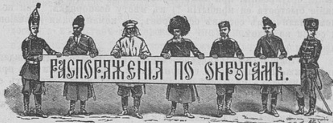
Приказъ по войскамъ Финляндскаго воен. округа, № 14.

ложенію дисциплинарныхъ взысканій на студентовъ тѣ же права, какія присвоены штабъ-офицерамъ, завѣдывающимъ обучающимся въ академіи.