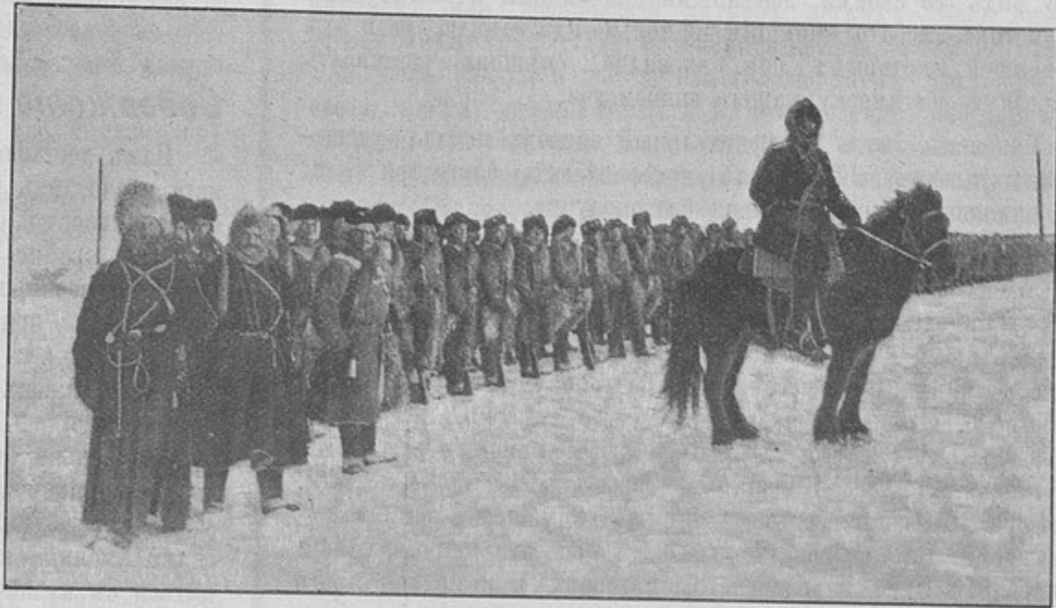
Монгольская экспедиція. Ноябрь и декабрь 1901 г. (къ статьѣ «Зимняя экспедиція полковника Ирмана въ Монголію»).

Какъ-то, стремясь на югъ, я вынужденъ былъ выѣхать изъ Питера съ курьерскимъ поѣздомъ, въ образѣ офицера, имѣя, однакоже, подъ шинелью солдатскій мундиръ, ибо отъ Вилейки на югъ мнѣ предстояло путешествовать солдатомъ. На Вилейской платформѣ, откозырявъ офицеромъ ожидавшему поѣзда командиру четвертаго корпуса съ его штабомъ, я бойко взошелъ въ залъ третьяго класса и своимъ появленіемъ взбудоражилъ цѣлую компанію бывшихъ тамъ