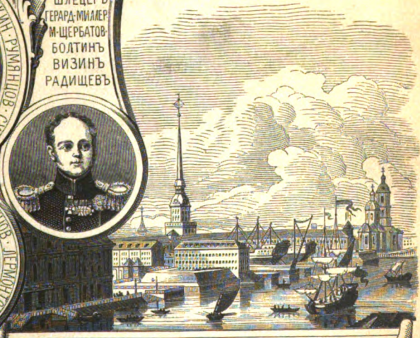
ЗИМНИЙ ДВОРЕЦЪ И ГЛАВНОЕ АДМИРАЛТЕЙСТВО ВЪ 1753 г.