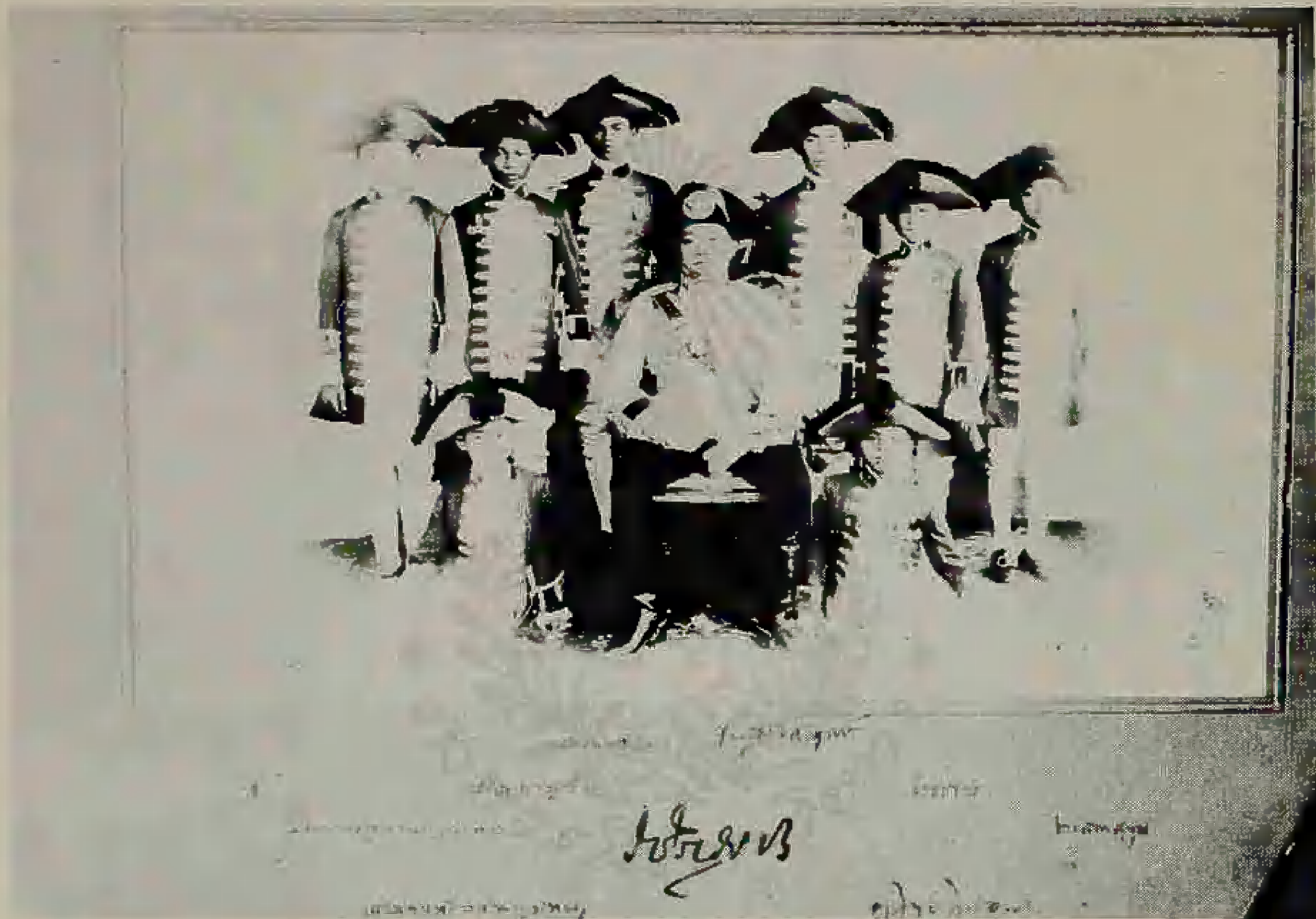
นักเรียนมหาดเล็กรับใช้รัชกาลที่ ๖ พ.ศ. ๒๔๕๘