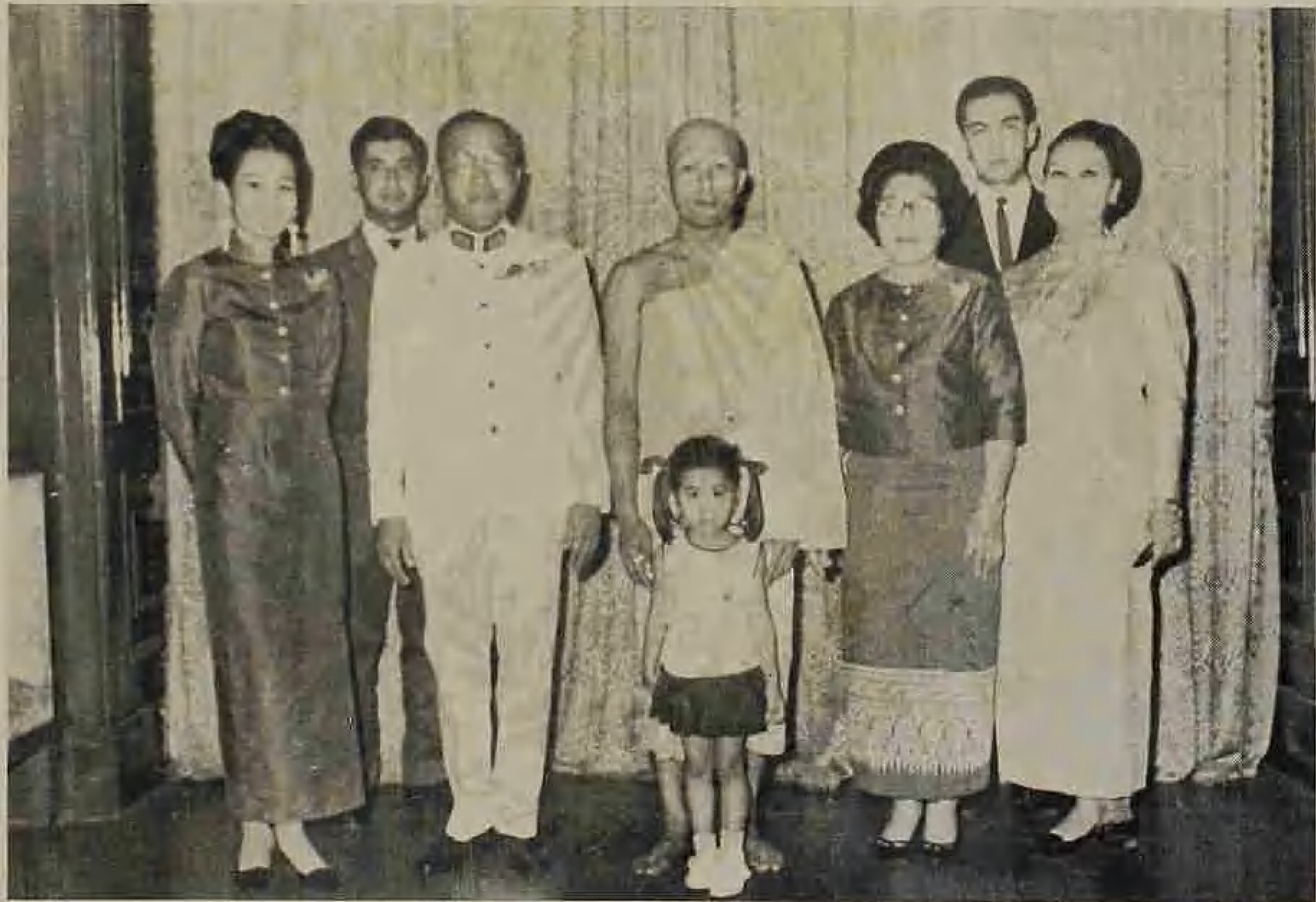
ถ่ายภาพพร้อมกับครอบครัว เมื่อลูกชายบวช พ.ศ. ๒๕๑๐