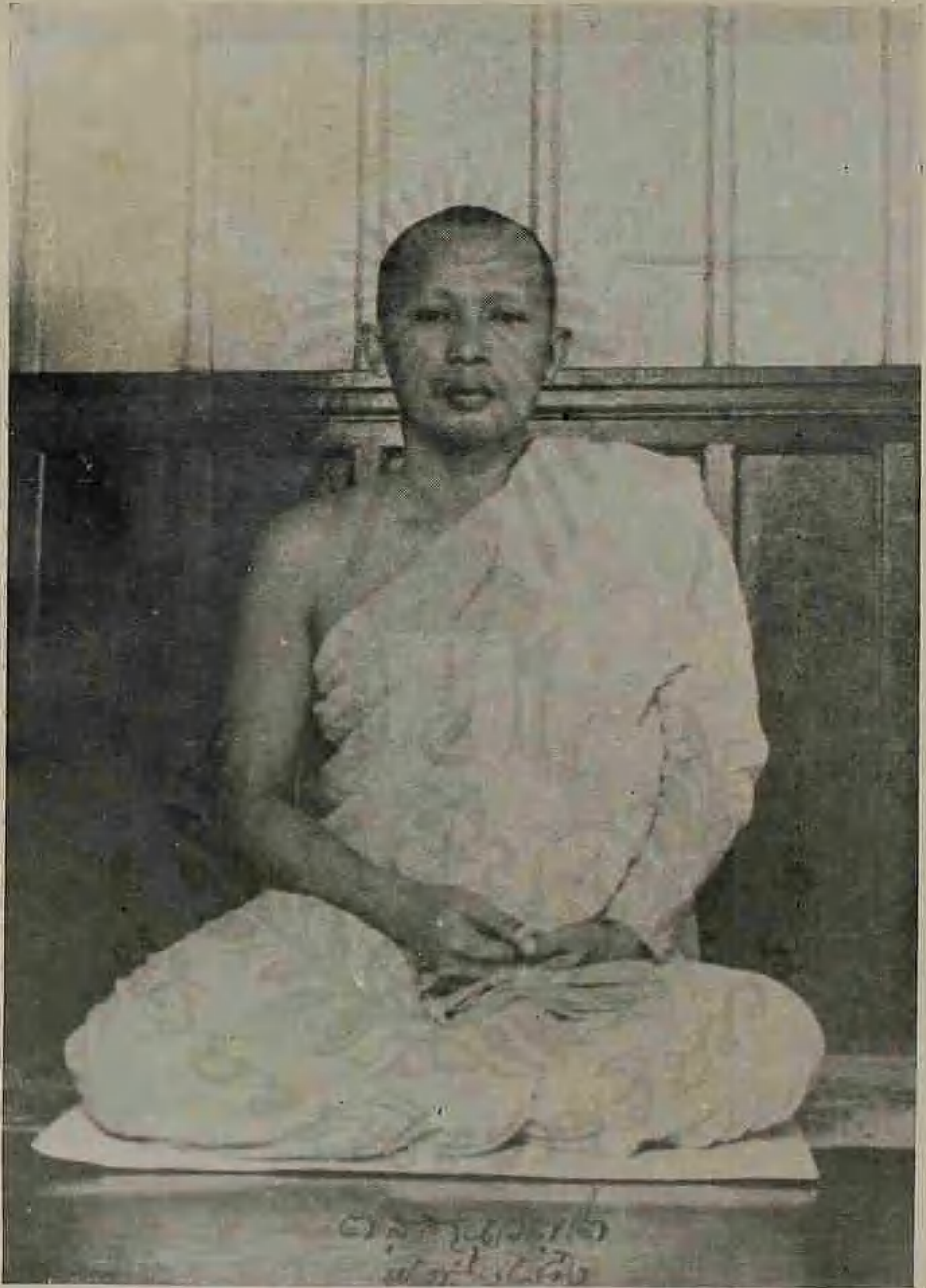
บวชพระอยู่วัดเทพศิรินทราวาส พ.ศ. ๒๔๘๒