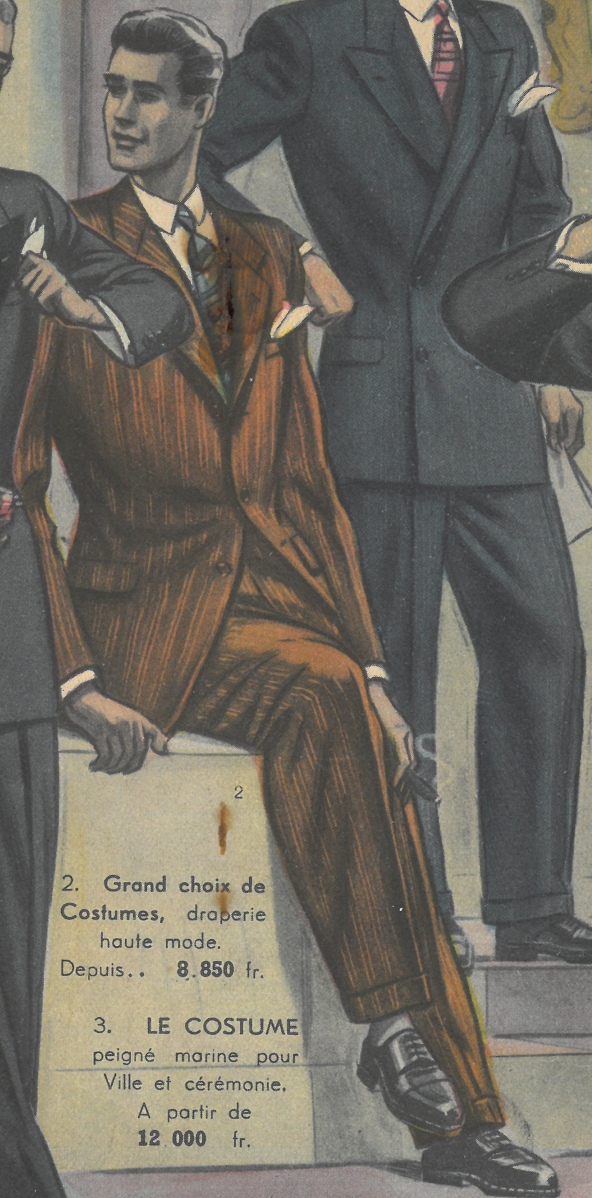
2. Grand choix de Costumes, draperie haute mode. Depuis.. 8.850 fr.