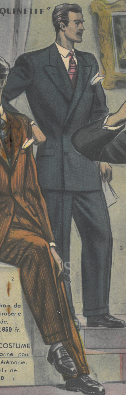
3. LE COSTUME peigné marine pour Ville et cérémonie. A partir de 12.000 fr.