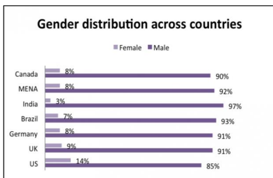
Abbildung 2: Geschätzter Frauenanteil in verschiedenen Sprachversionen der Wikipedia

Eine niedrige Frauenbeteiligung im Internet ist jedoch nicht nur auf Wikipedia begrenzt. Beispielsweise auch in sozialen Medien gibt es Gemeinschaften, in denen mehr männliche als weibliche Nutzer aktiv sind, z.B. Google+ oder reddit, aber auch diese wo Frauen in Überzahl sind, z.B. Facebook und Pinterest (McCandless, 2012). An den FLOSS Initiativen und Projekten (FLOSS sind Free/Libre Open Source Software bzw. Free and Open Source Software und bedeutet Freie Software und Open-Source-Software) beteiligen sich ebenfalls nur wenige Frauen. Nach dem FLOSS Survey (2012) beteiligen sich nur ca. 1.1 Prozent der Frauen an der Entwicklung von Open Source und Freier Software (Ghosh et al., 2002). Einige bestreiten diese Zahlen und behaupten, dass es mehr Frauen gibt, die allerdings durch neutrale Namen oder Anonymität unsichtbar bleiben. In mehreren FLOSS Communities werden Frauen gezielt angesprochen, z.B. im Rahmen von sogenannten Outreach Programmen zur Ansprache und Gewinnung neuer Mitglieder. Diese Maßnahmen können durchaus positive Effekte bringen, z.B. das Programm der GNOME Foundation (vgl. Gnome, 2013).