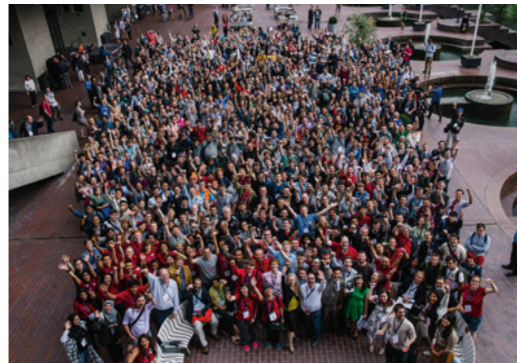
Groepsfoto tijdens Wikimania 2014. De jaarlijkse internationale meerdaagse conferentie van Wikipedianen werd dat jaar in Londen gehouden.

parante karakter van de encyclopedie. De meeste artikelen zijn het resultaat van samenwerking tussen meerdere auteurs. Het is geen uitzondering dat er tientallen of zelfs honderden Wikipedianen aan een enkel artikel meeschrijven. Bekijk de bewerkingsgeschiedenis van 'Jezus (historisch)' maar eens. Voortdurend overleg, onderlinge kennisuitwisseling en (nu en dan stevig) debat zijn onmisbare ingrediënten voor een goed artikel. Zo kunnen meerdere, mogelijk conflicterende interpretaties van een