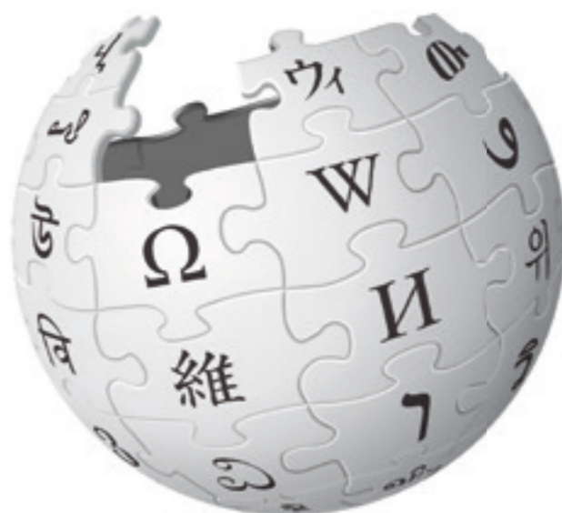
Het logo van Wikipedia.

staat het al jaren in de top tien van drukst bezochte websites, naast andere reuzen als Google, Facebook en YouTube. Hoewel het Nederlandse taalgebied een bescheiden omvang heeft, is Wikipedia in het Nederlands (nl.wikipedia.org) verrassend groot; met zo'n 1,9 miljoen artikelen zelfs groter dan de Chinese of Spaanstalige versies. Elke maand lezen twintig miljoen mensen er artikelen.