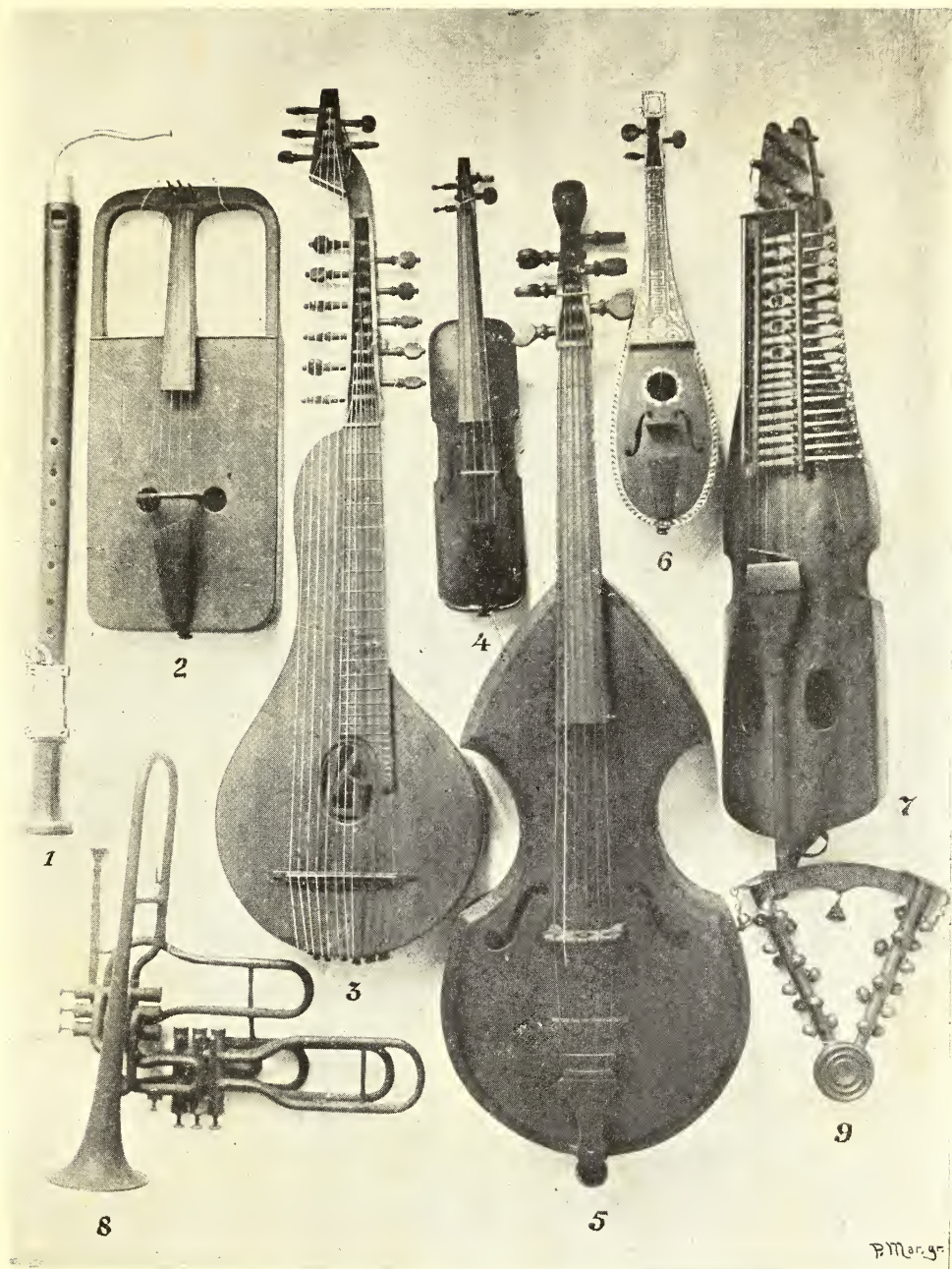
1— Flauta dôce de ponta. 2— Crout, do paiz de Galles. 3— Archicithara. 4— Rabeca de viagem. 5— Basso de viola. 6— Ribecchino. 7— Nyckelharfe, sanfôna suêca. 8— Nouvelle Trompette Sax. 9— Lojki, instrumento russo.