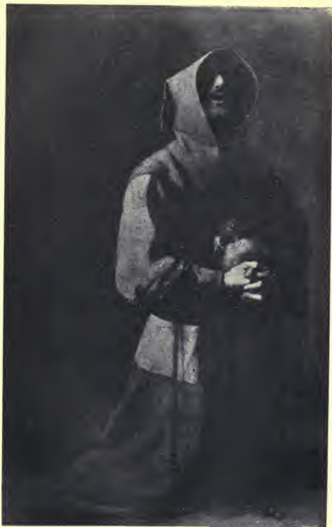
MONJE EN MEDITACIÓN Zurbarán