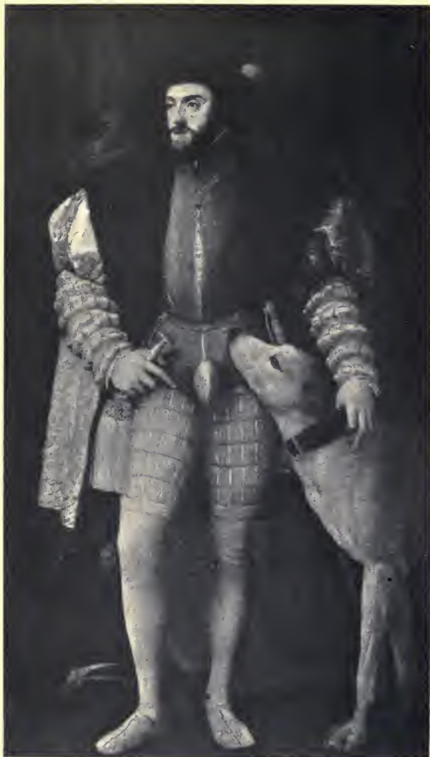
CARLOS QUINTO Titian