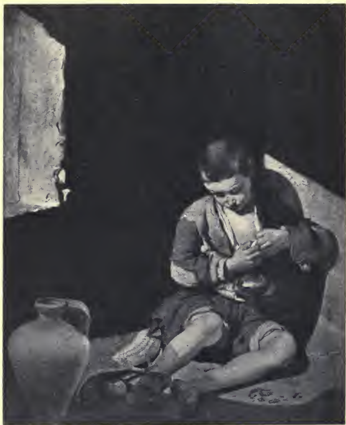
EL MENDIGUITO Murillo