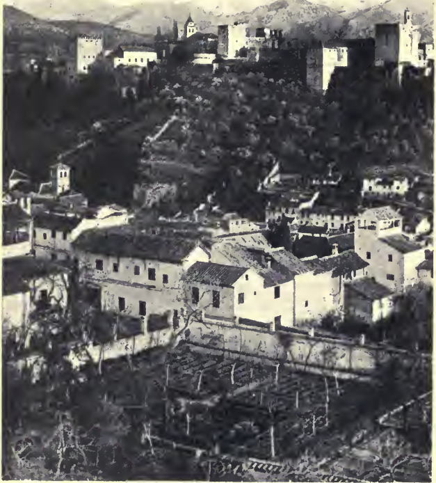
GRANADA. EL ALHAMBRA