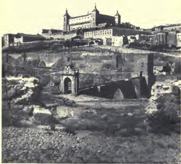
TOLEDO. PUENTE DE ALCÁNTARA