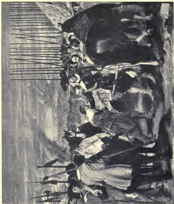
LA RENDICIÓN DE BREDÁ Velázquez