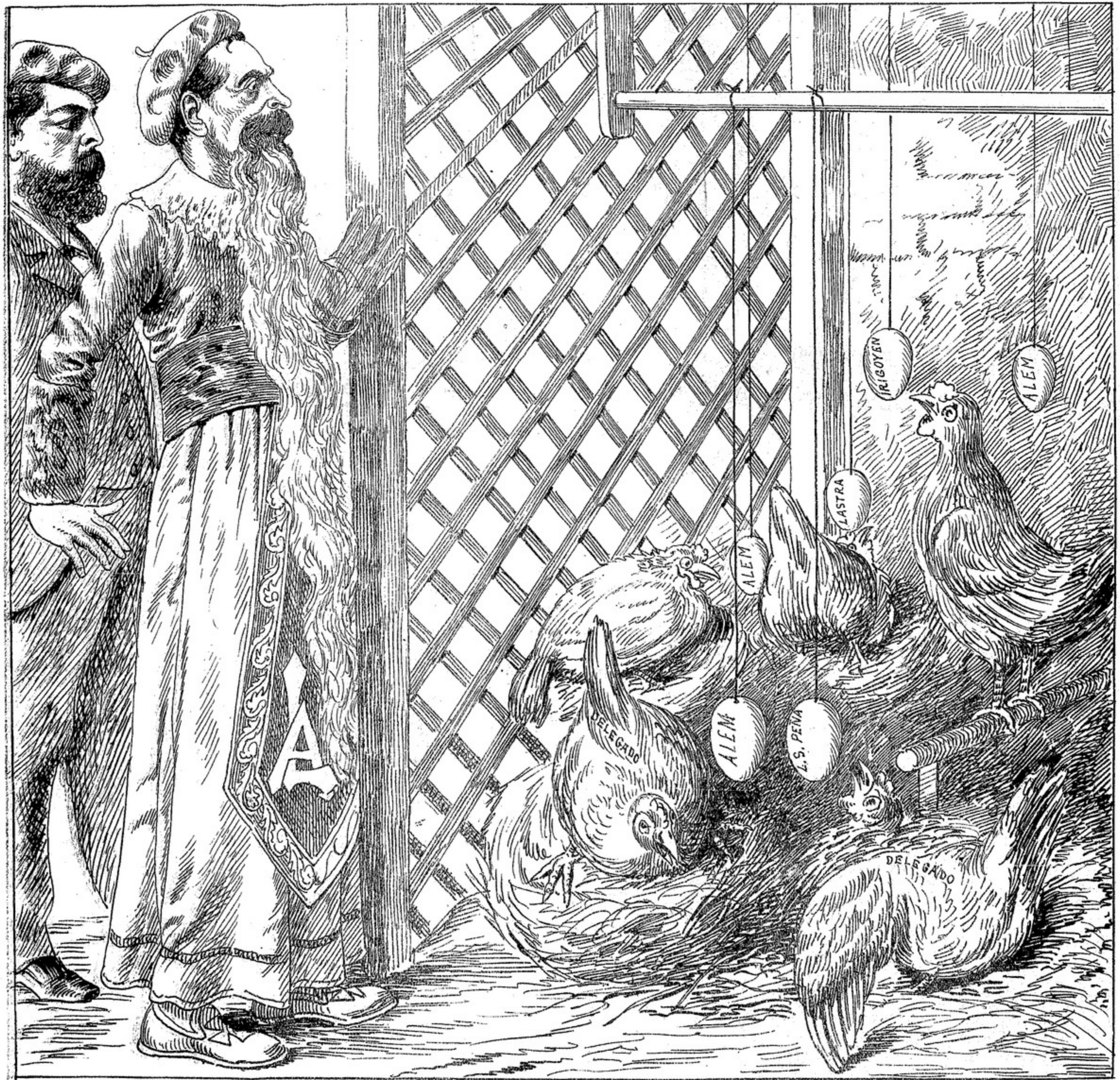
VISITA DEL PROFETA AL GALLINERO CIVICO