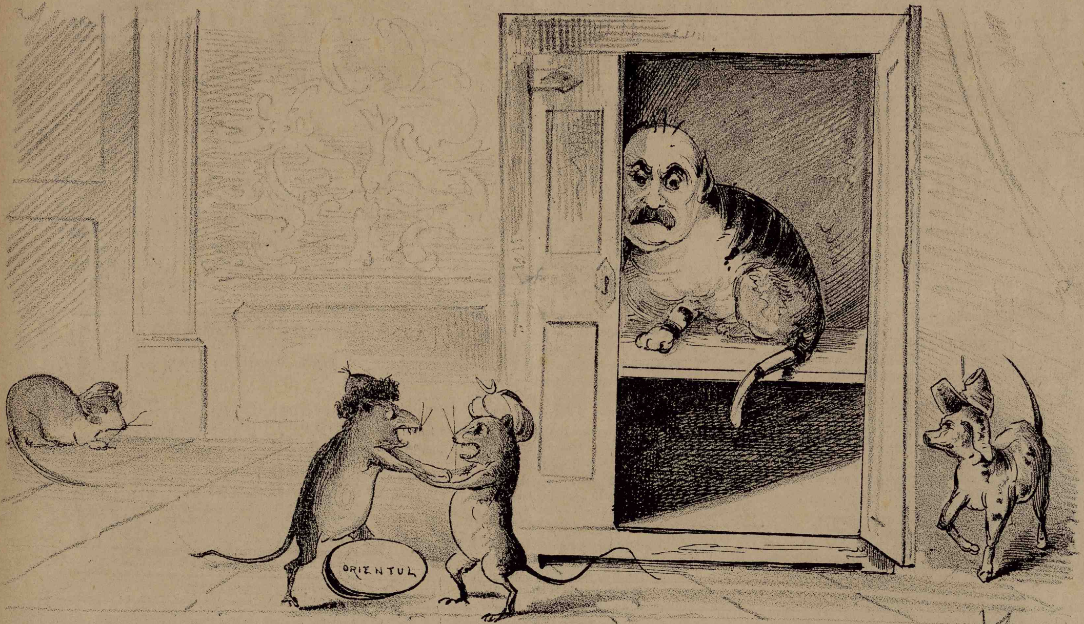
Fisica își pândește pradă, dar nici câinele nu stă nepăsător.