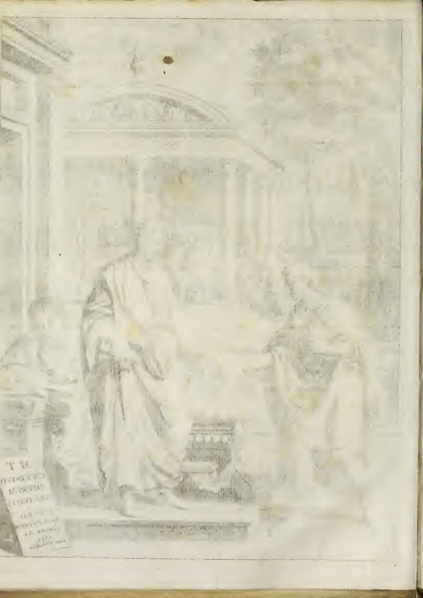
PLATE GENERAL VIEW OF THE TEMPLE OF APOLLO AT SOME OF THE SACRIFICES AND THE SACRIFICIAL TABLES

THE TEMPLE OF APOLLO AT SOME OF THE SACRIFICES AND THE SACRIFICIAL TABLES