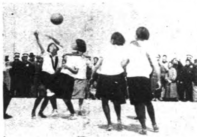
(右)女子籃球角逐之二幕

網球健將邱飛海前已入英國籍，不受中國法庭管轄。日前第二次開庭被告方面竟無人到庭。夫邱以開車不慎撞斃他人後，竟擬開車逃遁，顯然自知有過，又罪逃遁。而開審時，又自恃英籍，不受管轄，此舉不獨理由不足，抑且荒唐可笑。蓋邱曾歷云。(林冲) 網球健將邱飛海前已入英國籍，不受中國法庭管轄。日前第二次開庭被告方面竟無人到庭。夫邱以開車不慎撞斃他人後，竟擬開車逃遁，顯然自知有過，又罪逃遁。而開審時，又自恃英籍，不受管轄，此舉不獨理由不足，抑且荒唐可笑。蓋邱曾歷云。(林冲)