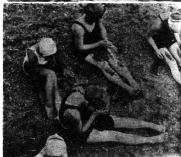
把自己 的頭， 埋在軟 棉棉的 細沙裏 ，別有 一番滋 味。