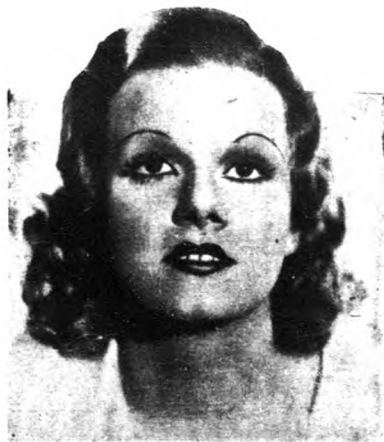
琪恩哈勞 (Jean Harlow)

廣州近日嚴厲取締奇裝怪服，復變本加厲，分發禁令通告各電影公司禁將奇裝怪服攝入影片，期求更大效果。並聞已飭知電影公司拍攝一種新聞短片，俾作取締運動擴大宣傳。新聞片之簡單畫面，則分為：(一)各服裝樣本(二)男性標準服裝表演(三)女性標準服裝表演等等，現正令致各家戲院放映，藉冀杜絕民間之惡風陋俗，當局用心良苦，蓋可知矣。