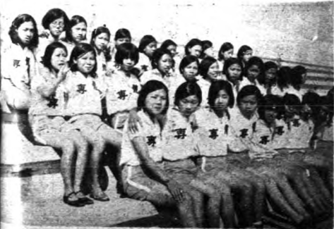
(下)訓練中的隊女籃球員