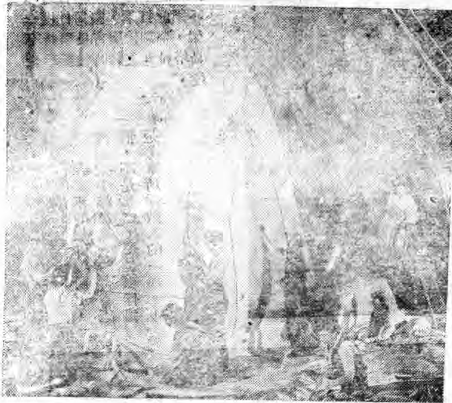
前方抗戰後方努力生產…… 上圖：英國婦女參加戰時軍事生產情形。 下圖：英美飛機，不停轟炸德寇海陸設備，這是 一架大型魚雷機裝置魚雷，準備出發時 的照相。