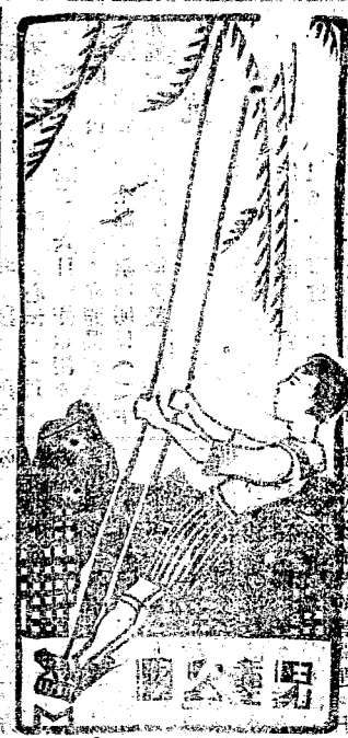
第七十八期 星期一 出版 湖南通俗日報