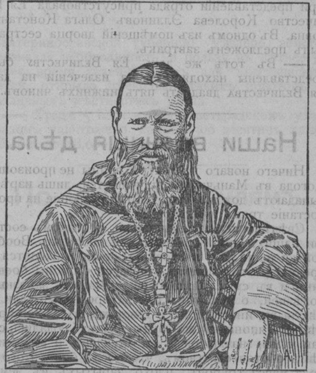
Настоятель Андреевскаго Собора въ Кронштадтѣ, Митрофорный протоіерей Отецъ Іоаннъ Сергіевъ (Кронштадтскій).

Давно извѣстно, что всякое общее дѣло требуетъ руководителя и исполнителей; не только люди, но даже и безсловесныя животныя подчи-