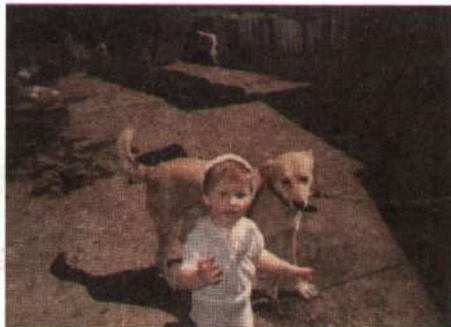
Мій вірний друг і страж!