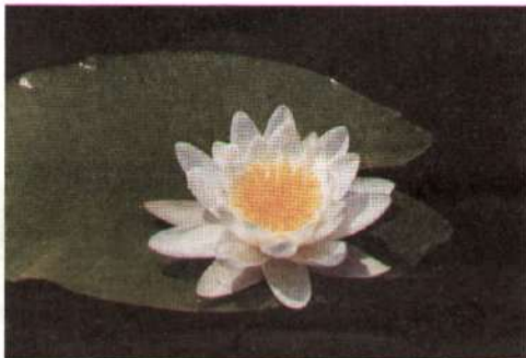
Сонце на долоні листка.