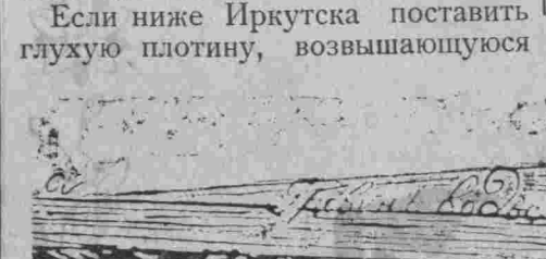
Надъ уровнемъ воды въ рѣкѣ на 2 саж., то вода подымается у плотины на 2 саж. и встрѣтитъ нормальный уровень воды въ точкѣ а — на разстоянйо отъ плотины вверхъ по рѣкѣ черезъ 10 верстъ.

Положимъ, шуга шла по рѣкѣ при уровнѣ воды (аб) и часть рѣки ниже сѣченйо (сд) стала. Слои воды, толшины скажемъ 0,50—0,60 саж. превратились въ ледъ. Вода притекая къ сѣченйо (сд) вынуждена будетъ протекать подъ этотъ ледъ и расходъ воды въ сѣченйо (сд) уменьшится, а притокъ къ нему останется прежнйо. Это обстоятельство повннжаетъ на понятыя уровня воды (аб) до уровня, скажемъ (сф). Высота этого понятыя и протяженйо, на которое окажетъ влннйо рѣкостава ниже сѣченйо (сд) зависитъ отъ состоянйо погоды при которой стала рѣка, отъ