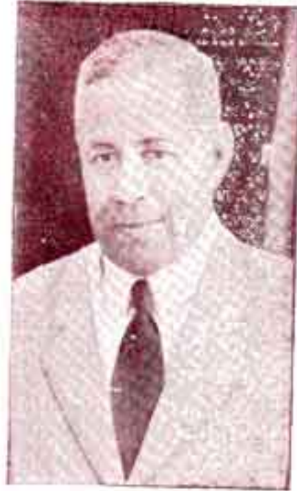
ஸ்ரீ ஜான் மத்தாய்