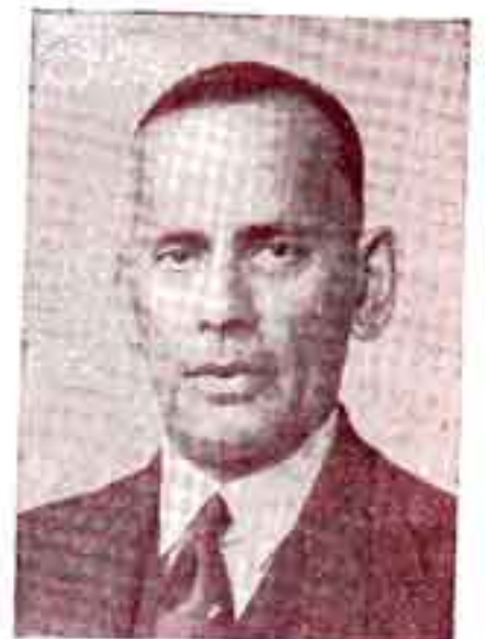
ஷயா அத் அநாமக்கார்