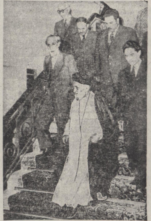
رئیس مجلس شورای ملی دیشب پس از پایان جلسه هفتگی مجلس را ترک نمود. آقای قائم مقام رفیع، آقای سید مصطفی کاشانی، آقای کریمی نماینده مجلس و چند تن از رؤسای ادارات مجلسی در عکس بالا دیده می‌شوند.

در جلسه دیشب ملاقات هفتگی آقایان نمایندگان با رئیس مجلس آیت‌الله کاشانی نمایندگان را به اتحاد و اتفاق دعوت کردند و اظهار داشتند بیایید بدون غرض و غری و خصوصیت و با در نظر گرفتن حق و عدالت مجلس را در مسیر طبیعی خود قرار دهید