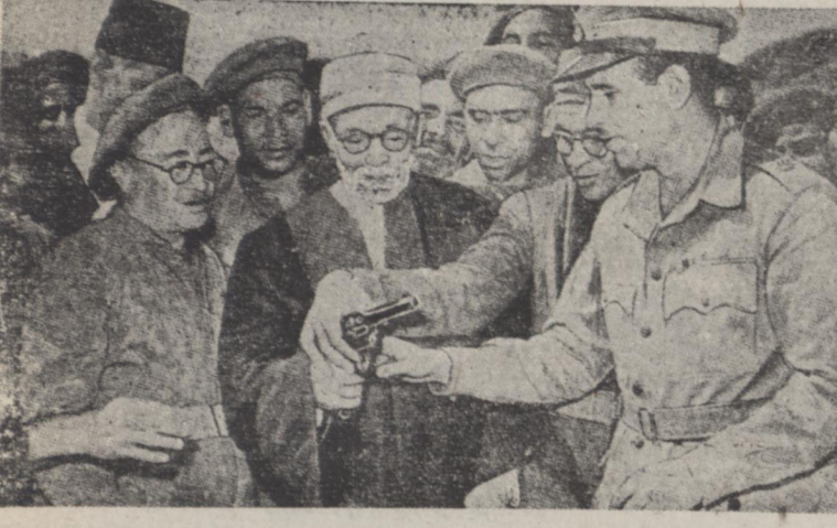
برای آنکه کلیه افراد کشور مصر مشمول اجرای برنامه فرارگرتن تعلیمات نظامی اجباری شوند پس از اینکه کلیه وزیران کابینه ژنرال نجیب در سر بازخانه ها با طرز استعمال سلاح مختلف آشنا شدند اکنون در دانشگاه الازهر کلیه دانشجویان و طلاب علوم دینی بفرارگرتن تون جنگی مشمول شده اند.

گراچی - روزنامه «تایمز» گراچی از رویه انگلیس در مورد مسئله کانال سوئز انتقاد کرده است و در مقاله خویش تحت عنوان «بیت قاهره» مینویسد: انگلیس ظاهرأ کرات خود را با مصر تجدید کرده لی در پان مایل شکست ملاکرات بود.