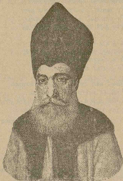
VORNICUL IORDACHE GOLESCU (1768—1848)