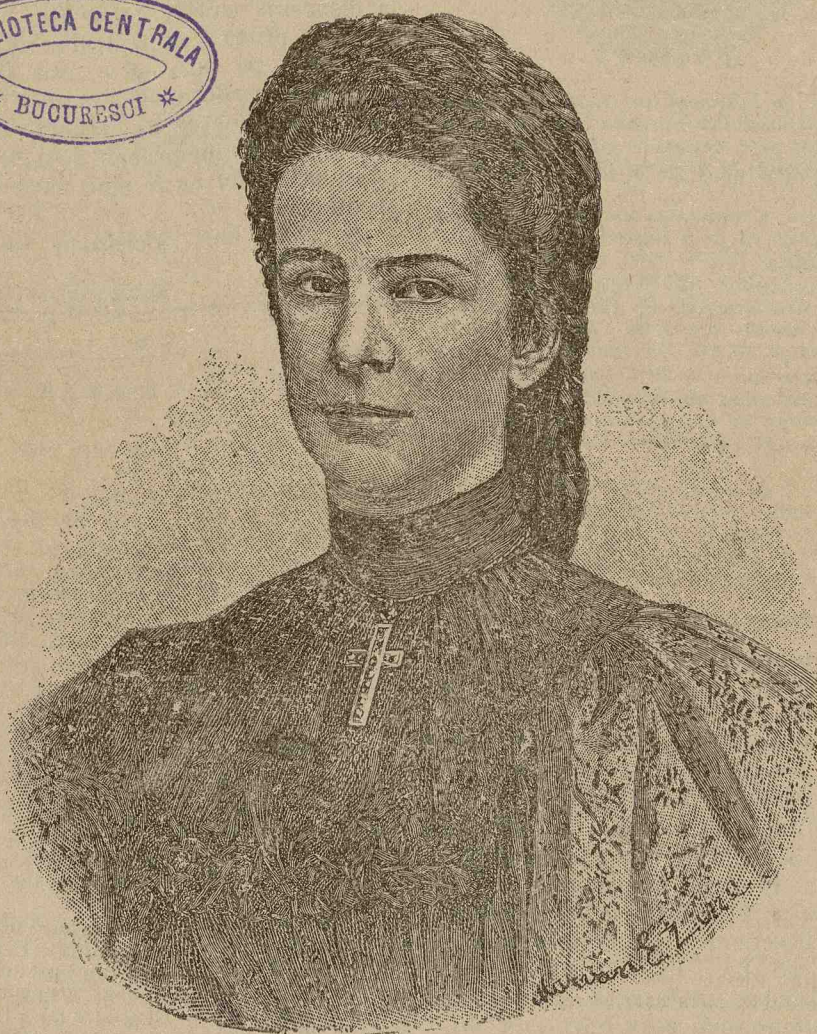
† IMPERATEASA ELISABETHA A AUSTRIEI (1837-1898)

Încă o victimă a unor idei bolnave a căzut la Geneva, în ziua de 28 August.