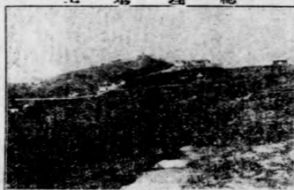
上 嘉 理 總

「一定也不喝了——還有，你們中國人見了面，不說「古得貓兒富」(早安)「古得耐體」(晚安)，總互相問「吃了沒有」，那怕在後黑哩見了面也」「吃了沒有」頭幾末，在不該吃飯的時候，我總回問「吃時皇子？」後來我明白了，也就回問一句「吃了沒有」(「後黑哩」者「夜晚」也「哈皇子」者