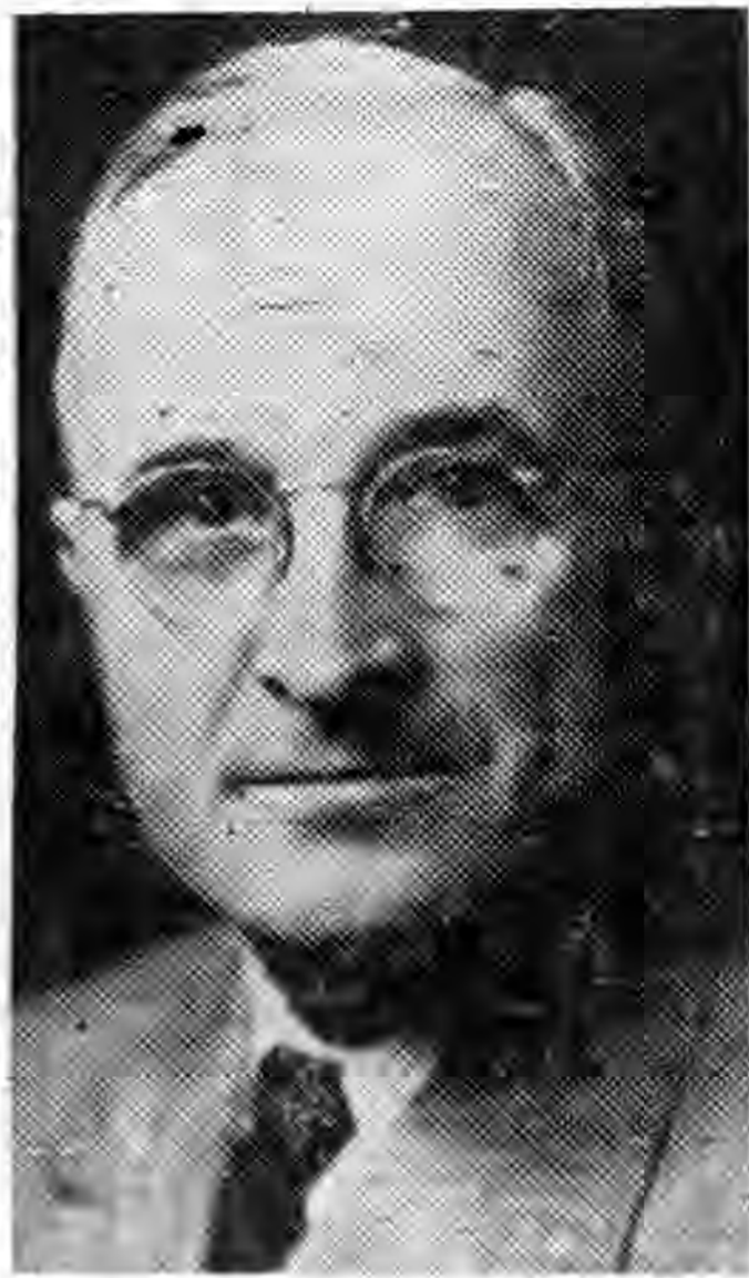
Harry S. Truman, President of the United States.