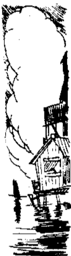
人人都愛鄱湖的美，我說沒有鄱湖，廬山的美，就要大大地減色了。站在廬山的諸峯巔看鄱陽湖吧！那浩渺烟波，那星羅棋佈似的島嶼，那點點的帆影，是怎樣在增加着你的懷的壯闊啊！

我愛鄱湖甚於廬山，鄱湖對於我是親切的。現在我們就單談談鄱湖吧！我曾經有這樣的在鄱湖旅行的經驗，在九江我乘着一隻叫做倒划子的船前往鄱陽。這船是小小的，在鄱湖中行駛，似乎會使你擔心，其實划船的船夫是鄱湖中的老水手，他是那樣熟練地安靜地在划着，坐在船中，我一面飽覽着湖光山色，一面跟船老頭聊天。