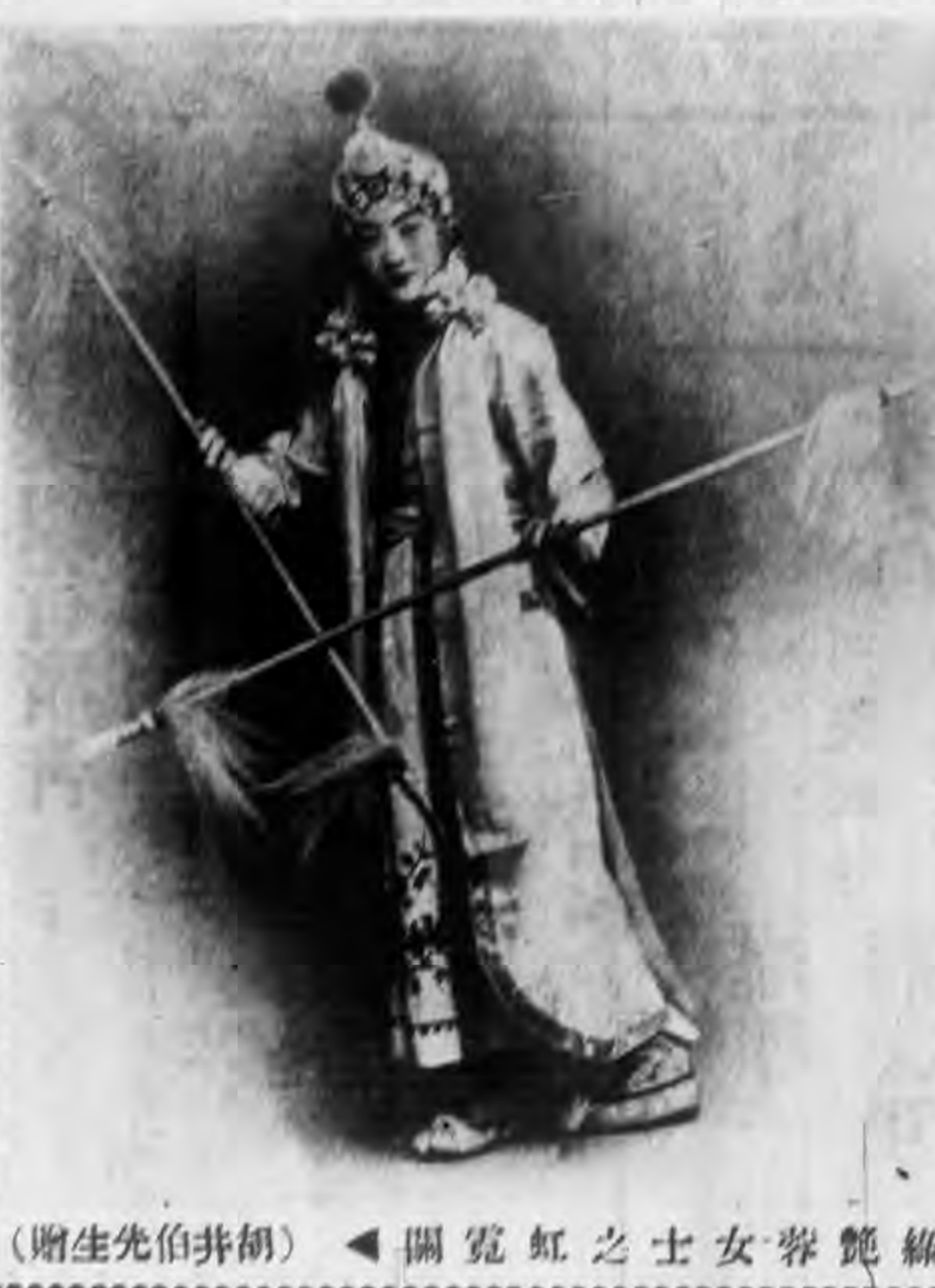
關寬虹之士女蓉鏡綠 (贈生先伯井胡)