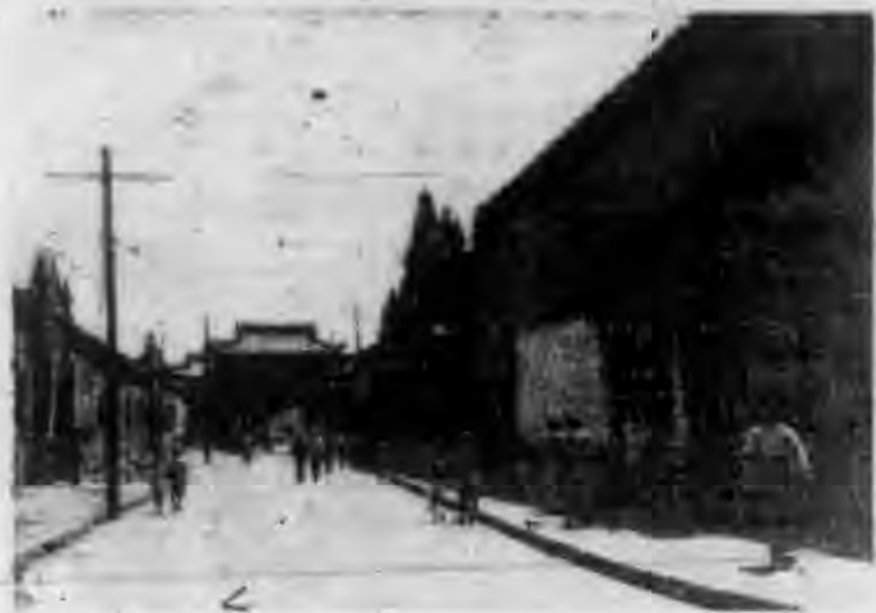
↑ 綏芬外東縣門街道