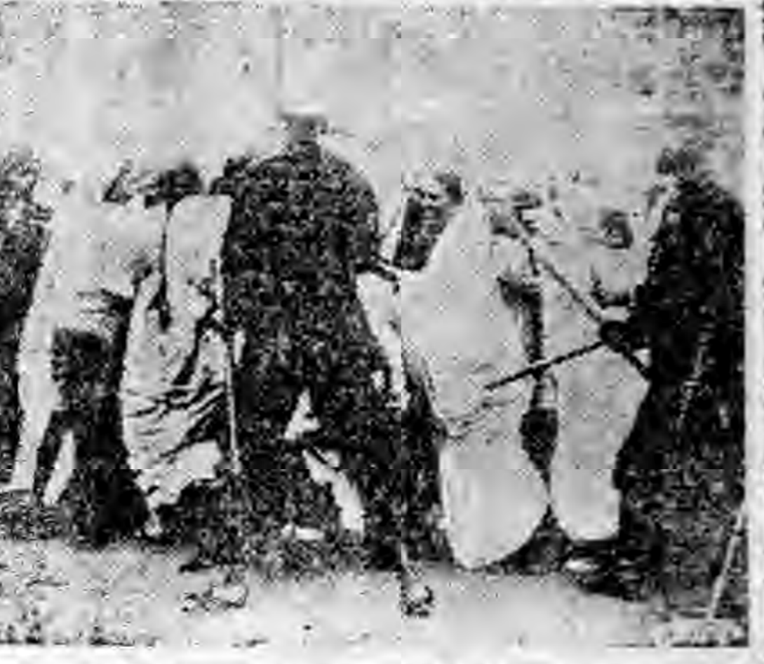
以兵力轉而對埃及宣戰