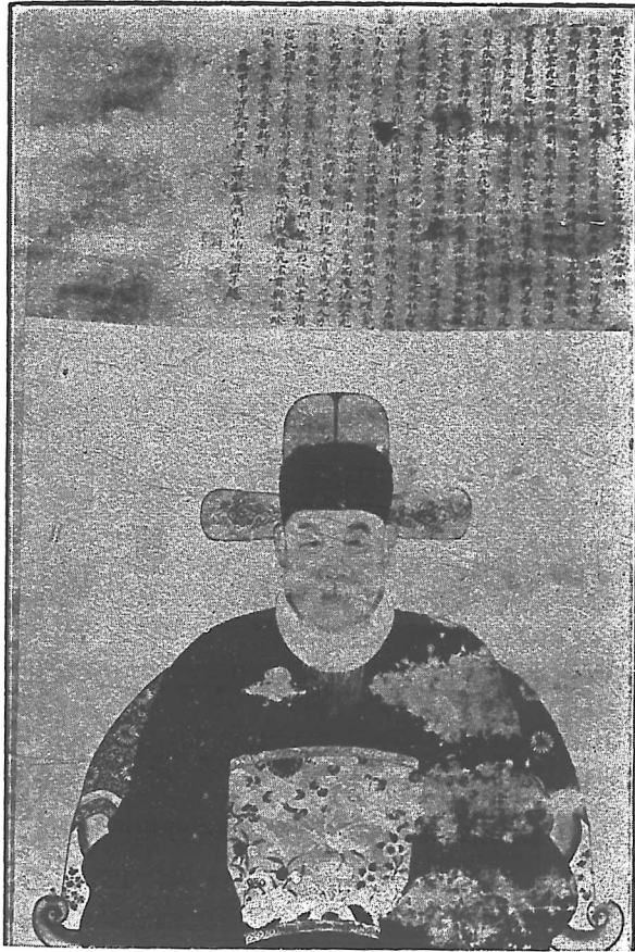
明賢王葵心斐理伯畫像