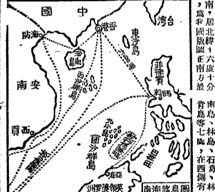
西沙羣島之位置圖

【本報訊】教員作小偷。教員作小偷之事實與影響。近日發生多起教員作小偷的案事件，引起了社會的強烈不滿。此類行為嚴重損害了教師的形象，也對學生產生了負面影響。