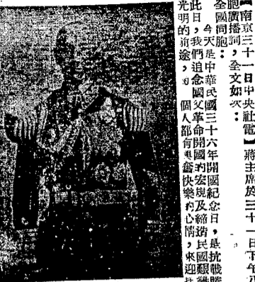
蔣主席於今日下午八時，在中央黨部舉行全體黨員大會，並發表重要談話。

【南京三十日電】蔣主席於今日下午八時，在中央黨部舉行全體黨員大會，並發表重要談話。蔣主席在談話中，剴切告同胞，重中政府決不變更和平方針。他強調，政府之政策，始終如一，即以和平方式解決國事。他呼籲全體國民，應團結一致，共同為國家之未來而努力。蔣主席之談話，獲得全體黨員之熱烈響應。