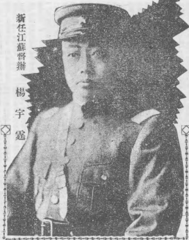
新任江蘇督辦 楊宇寬