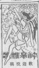
神筆雜稿 歡迎投稿