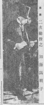
田中犬養兩氏回京 日攝政殿下定期出巡