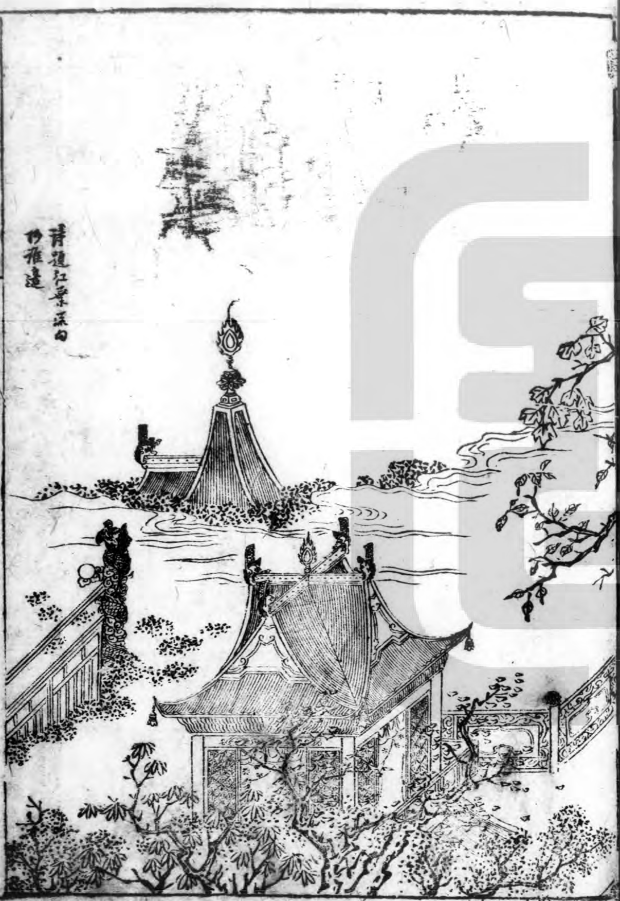
清道紅景深白 竹雅遠