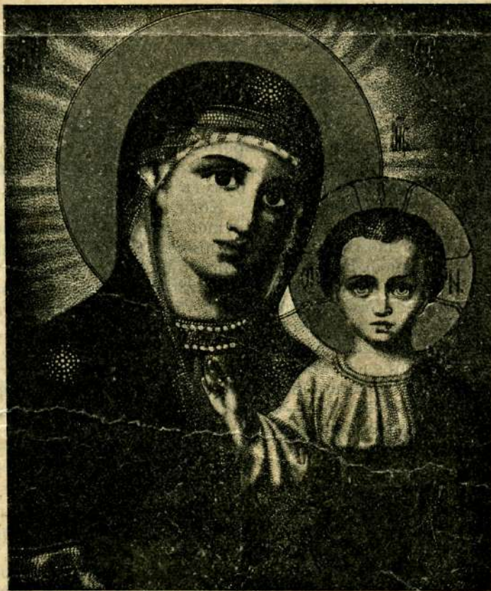
Изображеніе чудотворной иконы Божіей Матери „КАЗАНСКІЯ“.

О Пресвятая Госпоже Владычице, Богородице! со страхомъ, вѣрою и любовію припадающе предъ честною иконою Твоею, молимъ Тя: не отврати лица Твоего отъ приближающихъ къ Тебѣ. Умоли, милосердная Мати, Сына Твоего и Бога нашего, Господа Іисуса Христа, да сохранишь мирно страну нашу, да утвердишь державу благочестивѣйшаго, самодержавнѣйшаго, великаго государя нашего императора Николая Александровича, Церковь Свою святую да непозыблему соблюдетъ отъ невѣрія, ересей и раскола. Не имамы инья помощи, не имамы инья надеж-