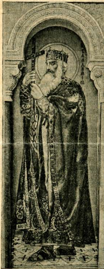
Св. Равноапостольный Князь Владиміръ.

тихій монастырскій звонъ. Доносится звонъ и отъ св. Софіи. Настанетъ вечеръ. Спокойное, темное южное небо раскинется надъ нимъ. Заблеститъ огнями крестъ въ его рукахъ. Заблестятъ огнями темнѣющія дали. И Днѣпръ и небо сливаются во мглѣ. И хочется смотрѣть... смотрѣть—и молчать. А въ рукѣ князя высоко надъ городомъ и надъ Днѣпромъ и надъ толпою людскою блистающей огнями—крестъ. Крестъ! .. Прошло болѣе тысячи лѣтъ, какъ засіялъ онъ надъ Русью, и она, скорбная въ минуты скорби, радостная во дни радости, съ тѣхъ поръ склоняется поды сѣнь креста, вѣрующая, смиренная, молящаяся. Ночь... Пирамидальный тополь стоитъ неподвижно, и весь онъ трепетное ожиданье, безмолвное стремленіе къ небесамъ. О чудная, тихая ночь! И къ небу стремясь, на небеса указываетъ намъ св. князь, и въ поднятой рукѣ его горитъ огнями—крестъ.