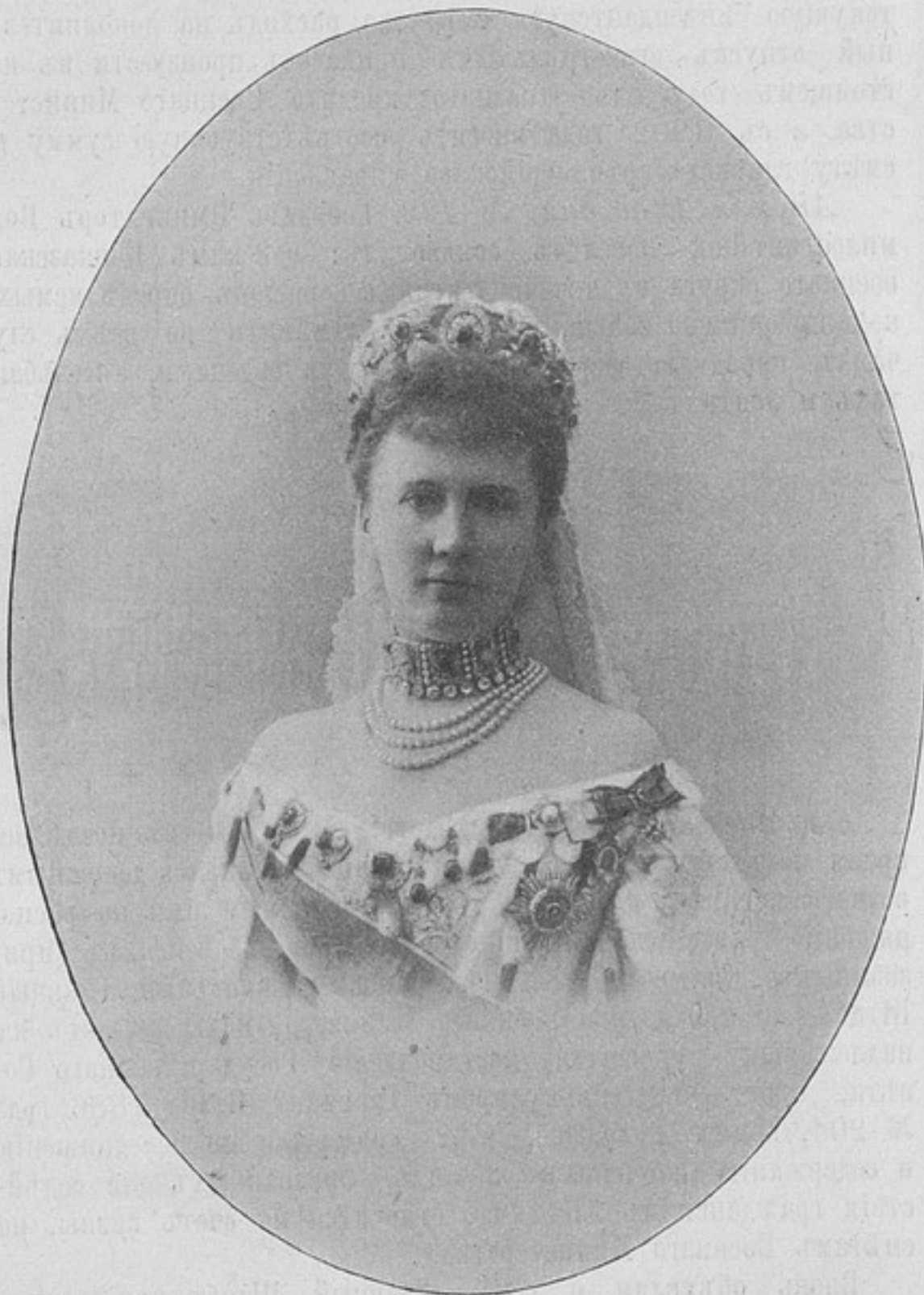
Ея Императорское Высочество Великая Княгиня ЕЛИСАВЕТА МАВРИКІЕВНА. (къ рецезіи «Календарь Синяго Креста»).