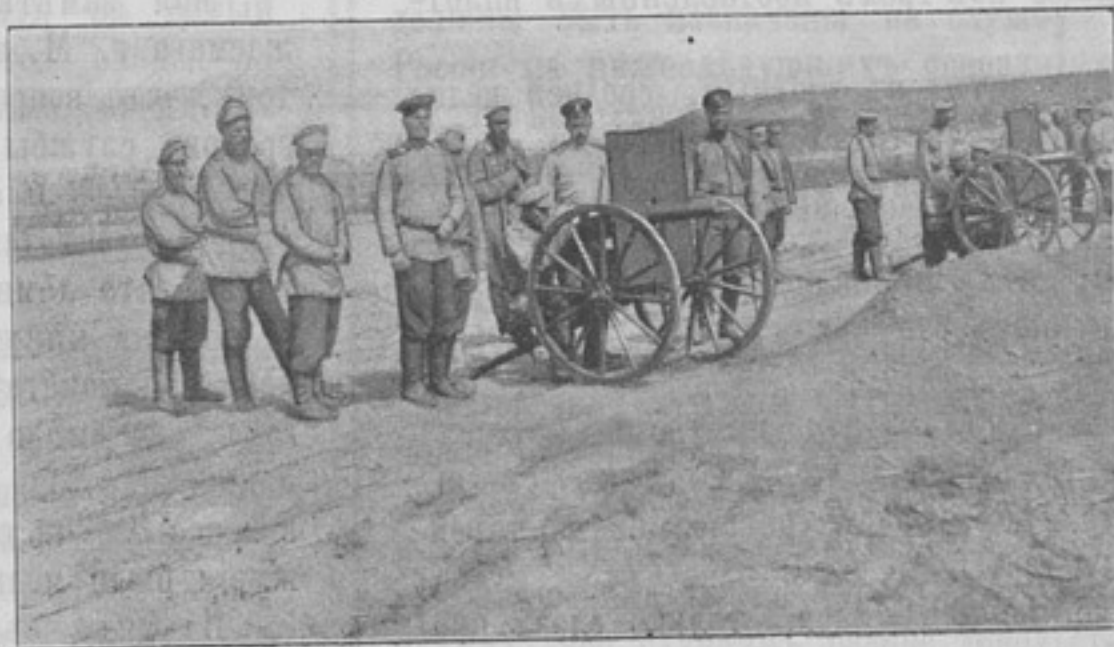
Пулеметная рота 3-й Сибир. пѣх. дивизіи.]