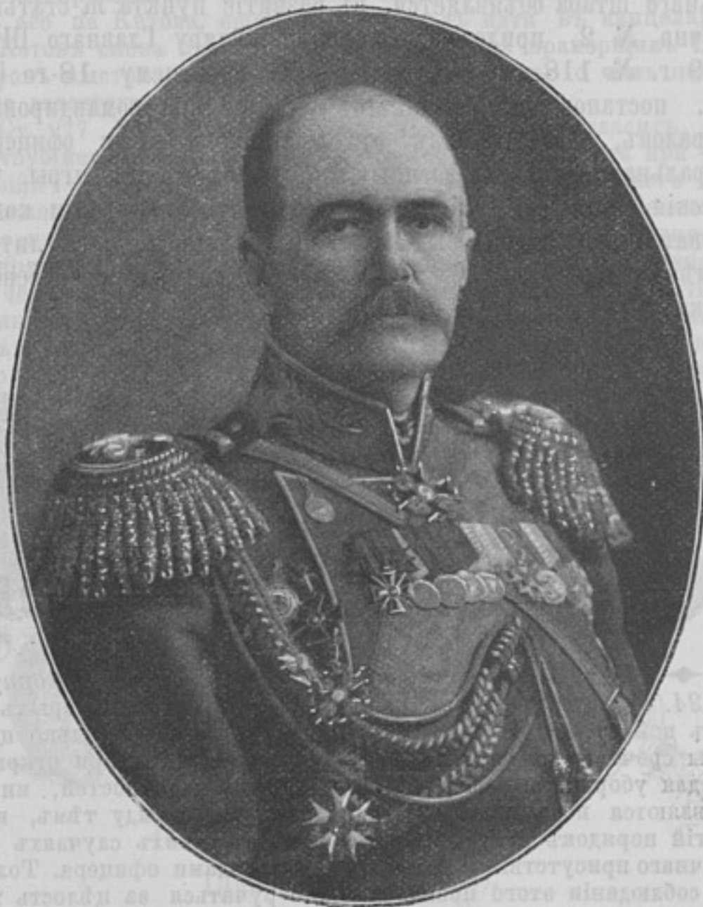
Варшавскій генералъ-губернаторъ и командующій войсками Варшавскаго военнаго округа, генералъ-адъютантъ, генералъ-лейтенантъ