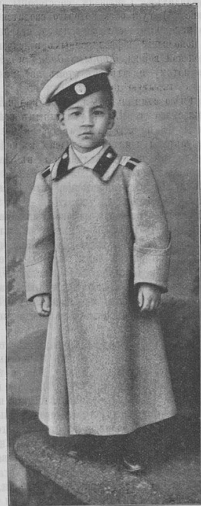
Суньянъ-Вантай (къ ст. «Сынъ полка Приморскихъ драгунъ»).

Полковые сыновья и дочери издавна существовали въ нашихъ войскахъ, и обычай этотъ присущъ кажется] только