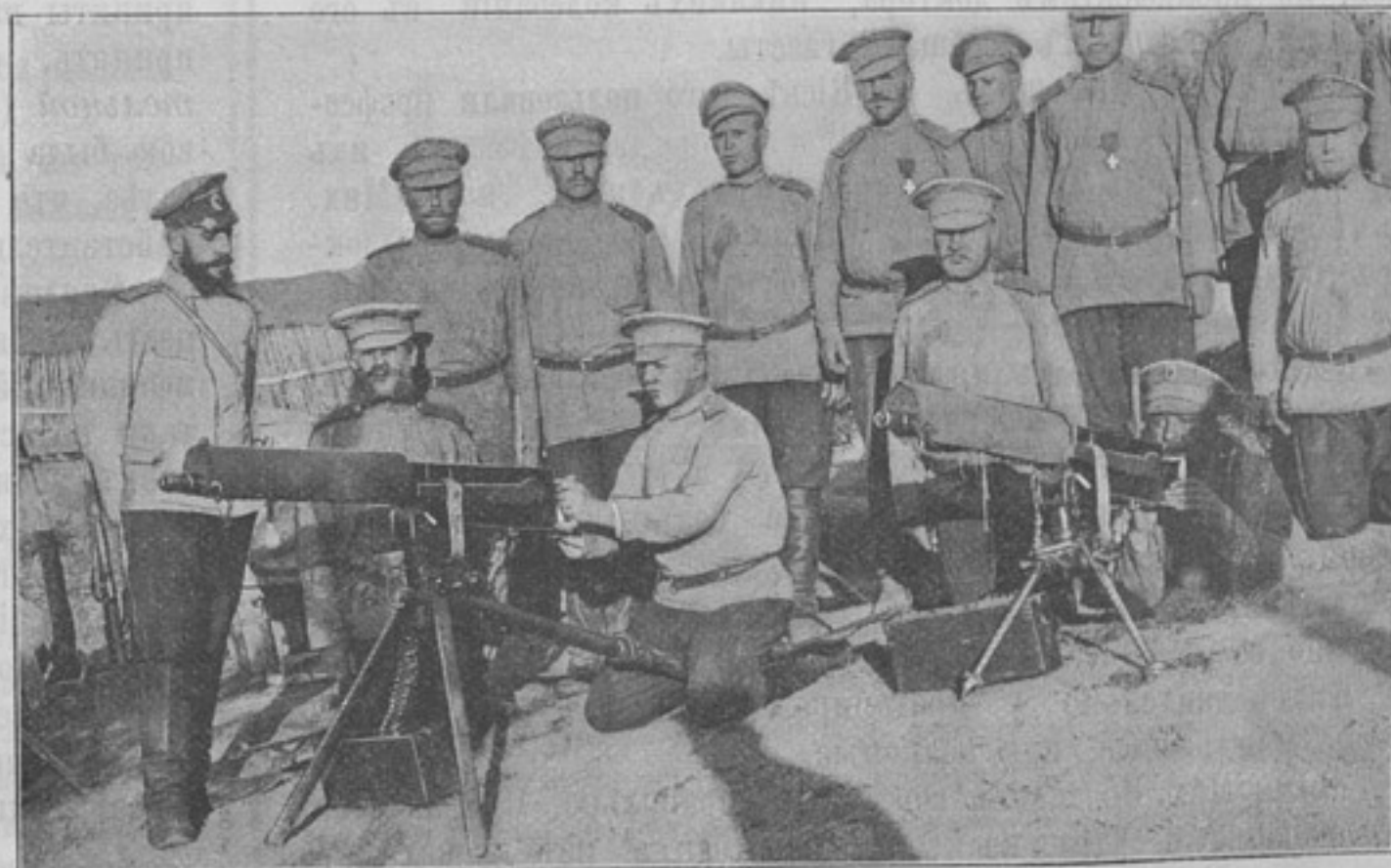
(Къ ст. «Пулеметы на треногѣ»).