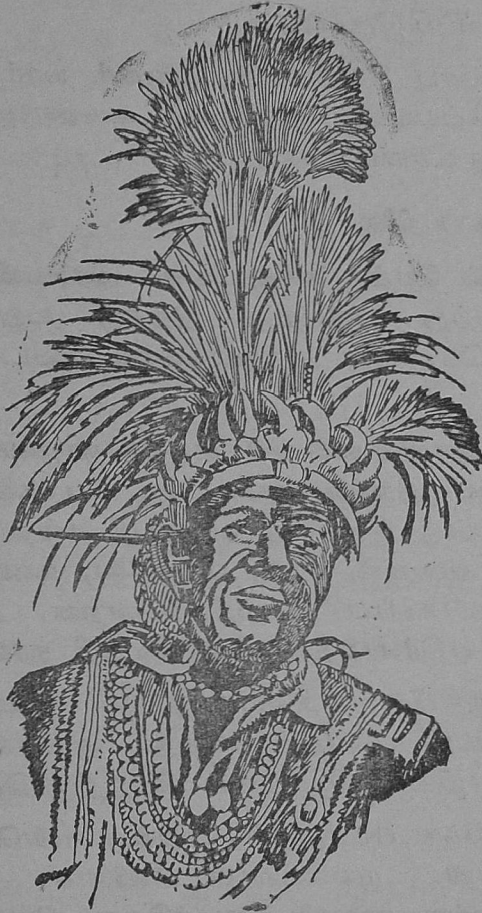
தொல் மரபினத் தலைவர்

காஞ்சி அரசியல் சட்டப்படி ஒவ்வொரு பகுதியிலும் தொல் மரபு இனத்தின் தலைவர்கள் அடங்கிய அவை இயங்கி வருகிறது. தலைமுறை தலைமுறையாக சிறு கூட்